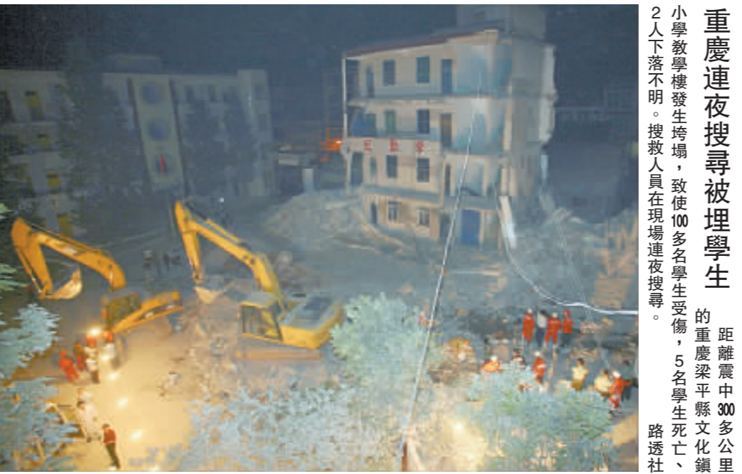
重慶連夜搜尋被埋學生 小學教學樓發生垮塌，致使100多名學生受傷，5名學生死亡，路透社