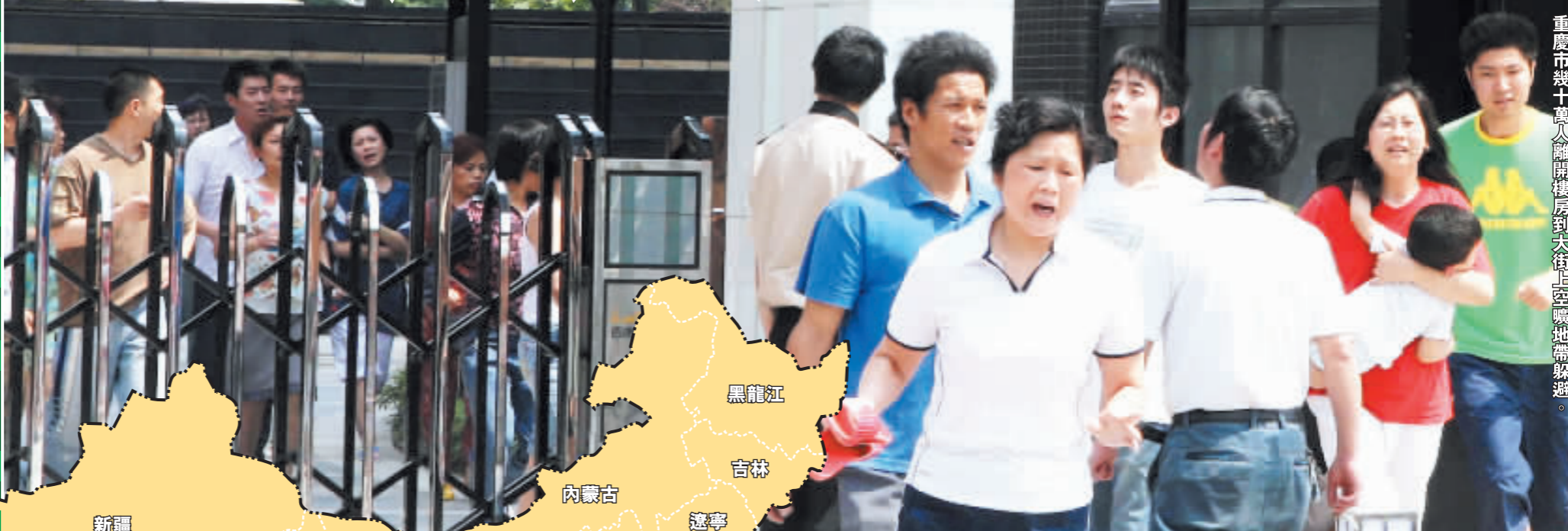
重慶市幾十萬人離開樓房到大街上空曠地帶躲避。

四川 餘震達313次，其中6級以上餘震2次，5至5.9級餘震5次，死亡人數8500多人，傷者逾萬人。成都市發生44次餘震，最大震級5級，造成45死，600多人傷，其中重傷58人。 甘肅 地震造成10人死亡，14人重傷，死傷者均為房屋倒塌所致。 陝西 陝西漢中寶雞一帶震感強烈，西安吊塔在高空折斷。 山西 太原地區有強烈震感，不少單位提前下班。 河南 河南鄭州市民普遍感到較為強烈的震感，室內吊燈劇烈晃動。 湖北 民眾有序撤離到空曠地帶，幼兒園放假商場關門。滬蓉西高速公路的大橋施工主纜在地震發生後漂移達1米。 湖南 地震持續約40秒鐘。房屋震動明顯。 雲南 雲南楚雄、昭通等地有較為強烈的震感，並有部分房屋倒塌。 廣西 廣西南寧市「第一高樓」地王大廈等高層建築搖晃。 江蘇 江蘇一些高樓裏的辦公人員、居民感到門、燈等晃動，有人有眩暈感。 上海 大樓搖晃5分鐘。 北京 出現約1分鐘左右震感。 台灣 搖動超過2分鐘，震動比台灣南投「9.21」大地震劇烈。