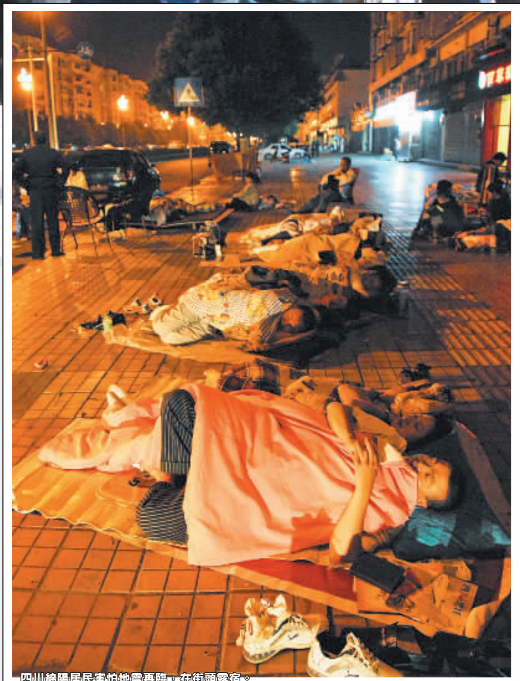
四川綿陽居民害怕地震再臨，在街頭露宿。