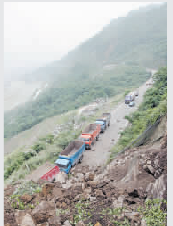
離都江堰市區5公里處的水井灣大橋發生大面積垮塌，造成去汶川的公路受阻。