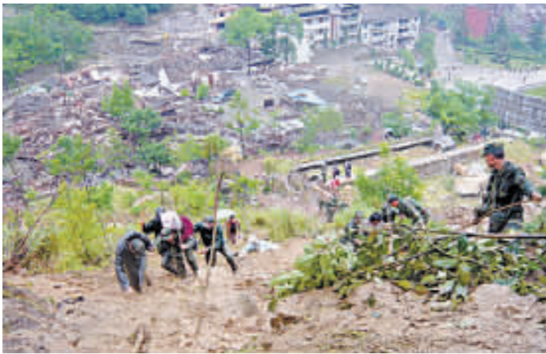
北川縣城與外界唯一道路被滾石阻斷，幾成一座孤島。救援人員將被困群眾從山腳背到山頂。