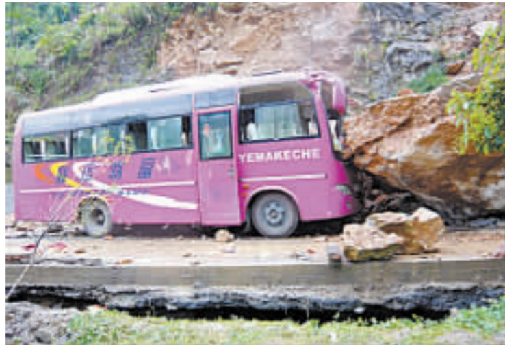
通往北川縣的公路已分層變形，一輛被巖石擊中的大巴車車頭嚴重變形。