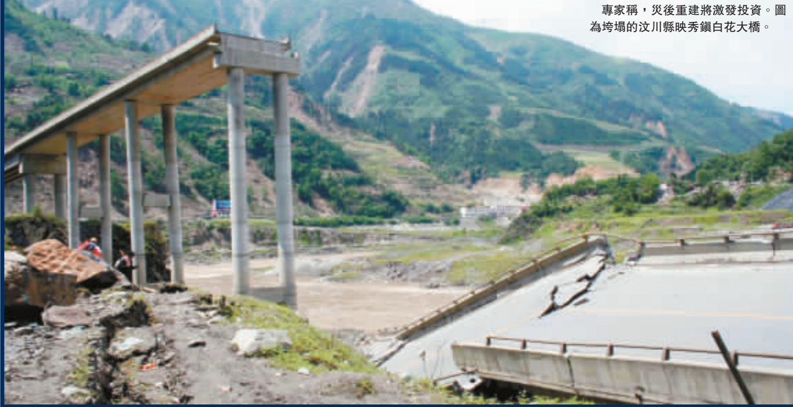
專家稱，災後重建將激發投資。圖為垮塌的汶川縣映秀鎮白花大橋。

因通脹壓力升高，地震也增加了央行加息的可能性。不過沈明高綜合分析後認為，今年只有一次加息的可能性，可能發生在第二季度。