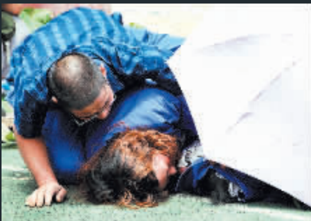
雙親抱着死去的孩子，說不盡的傷心。