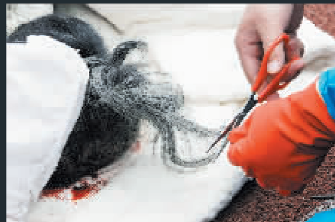
留下親人的髮絲，以作生的紀念。