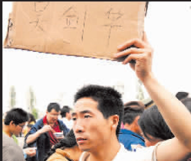
一位市民在四川綿陽市九州體育館前舉著牌子找人。