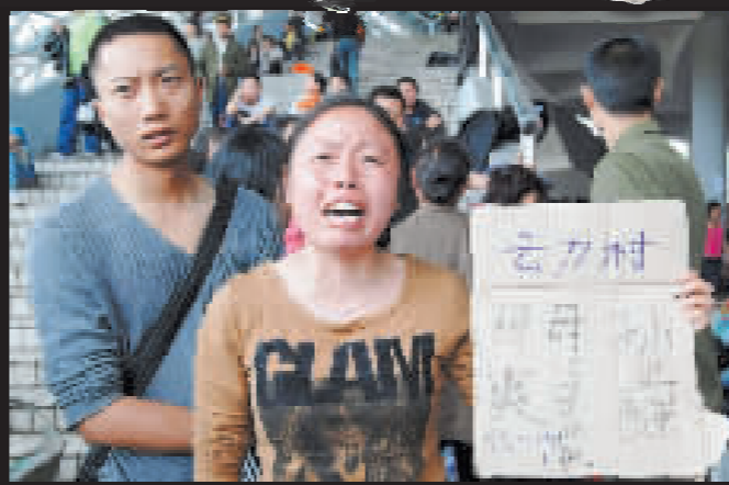
在綿陽市一個臨時作為安置中心的體育場館，一名婦女舉着牌子，上面寫着她的失蹤家人的名字，悲從中來，哭泣不停。目前綿陽市約有一萬名生還者被安置在體育場所，得到食物和庇護。