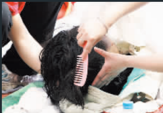
為死去的親人梳理頭髮，好讓他們整齊地上路。