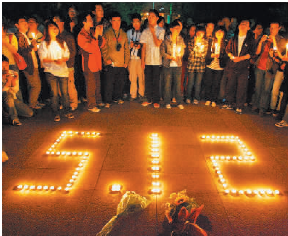
在北京一間大學，大學生參加為四川大地震的死難者舉行燭光守夜悼念儀式。