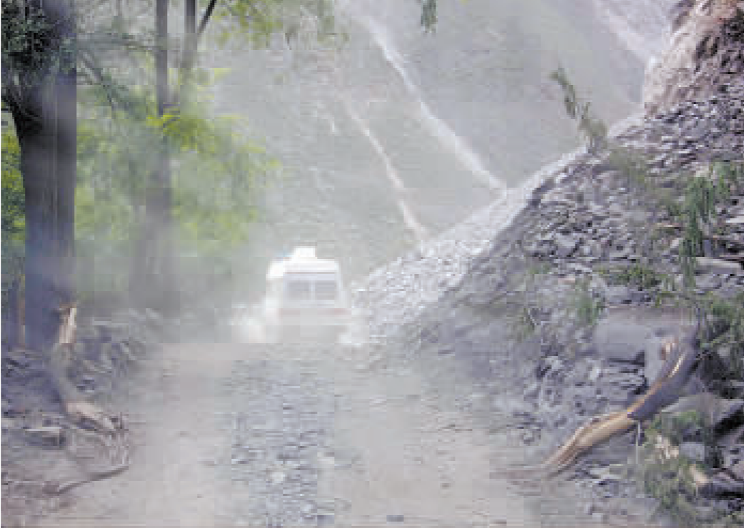
西線經理縣進入汶川道路打通，一輛救護車行駛在通往汶川的「生命線」上。

另據總部位於杭州的小靈通運營商斯達康公司公布的消息，15日12時汶川縣城小靈通通信已恢復。