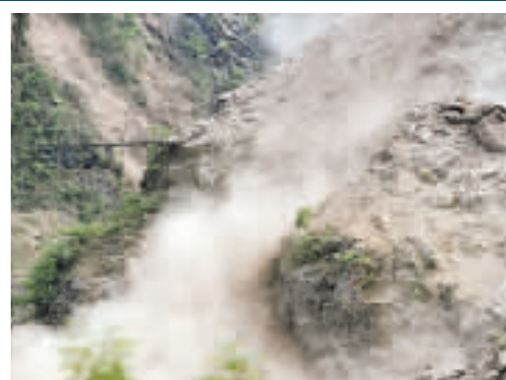
總理抵達青川當日，青川仍餘震不斷，山石滾落。