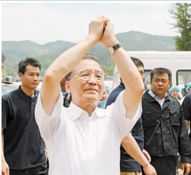
15日，溫總在青川縣木魚鎮，向群眾抱拳致意。

回良玉抵川輔溫總 新華社最新消息顯示，溫家寶15日輾轉來到川北重災區——廣元市青川縣木魚鎮慰問受災群眾。 在當地，溫家寶表示國家不會忘記受災的偏僻山村，鼓勵大家振作精神，互相幫助，重建家園。 而在14日晚由成都開往廣元的列車上，溫總還召開國務院抗震救災指揮部會議，再度強調救人仍是當前救災工作的重中之重，並決定向災區新增90架直升機，用於緊急救援。 另據報道，15日，國務院副總理、抗震救災總指揮部副總指揮回良玉已趕抵受災最嚴重、傷亡人數最多的四川綿陽災區。