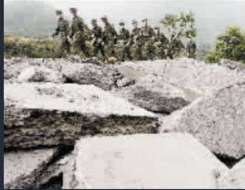
部隊穿過落石，向北川挺進。