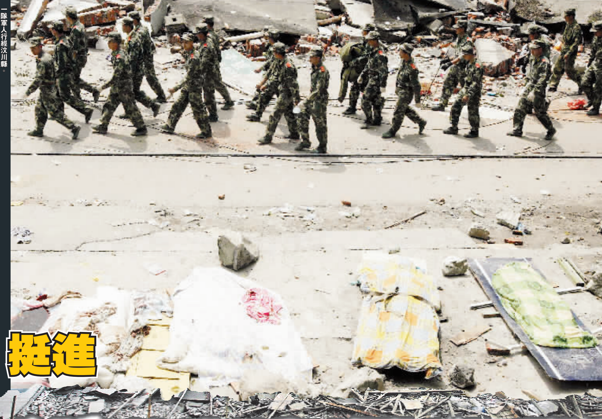
一隊軍人正行經汶川縣。