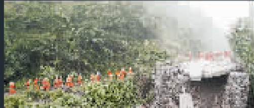
前往什邡的路已被震斷，救援人員只有沿着山邊的小路行軍。