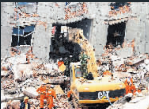
救援人員在什邡市鑾華鎮化工廠廢墟中搜救。