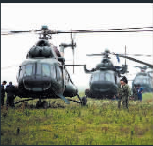
直升機緊急增援地震災區。