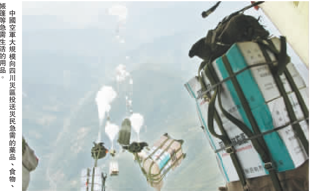
中國空軍大規模向四川災區投送災民急需的藥品、食物、帳篷等急需生活的用品。

中國抗震救災前線指揮部16日下達以重災區、搜救盲點為重點發起搶救生命總攻的命令後，軍隊抗震救災指揮部動用軍隊戰略儲備，再次向災區緊急空運1154噸急需物資，並向災區增派2所野戰醫院和10支野戰醫療隊，2輛最先進的新型野戰