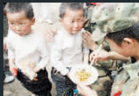
一對從安縣高川鄉解救出來的雙胞胎兄弟還未從震撼中回過神來，嘴裏不停叫着媽媽。