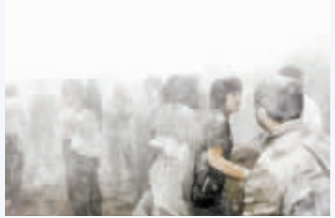
震動漸漸停止，灰塵逐漸散開，倖存者驚恐地從地上爬起來四處張望。