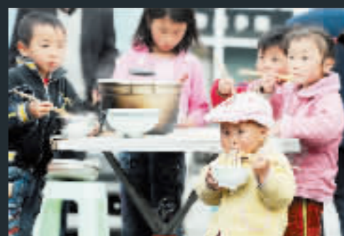
茂縣縣城已恢復自來水供應，一些孩子終於有飯吃了。