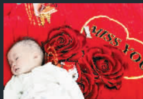
嬰兒安穩的睡在床上，顯然並不知道親人已在地震中失蹤。