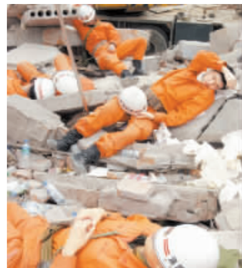
救援人員在災區不斷尋找生還者，根本顧不上休息。倦極時，他們只能在附近酣睡。

16日當晚，紙條被送到成都一家媒體，17日一大早，記者就開始撥打紙條上的電話，2位志願者主動加入。直到下午6時，志願者才通過電話、短信方式逐一把信息通報完。