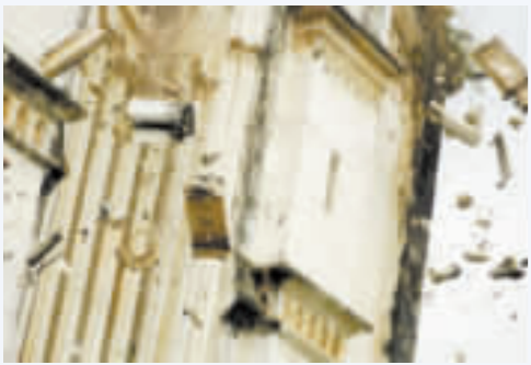
大量石塊從教堂上面飛落，大地開始搖晃，這時候才意識到是地震發生了！因為已經無路可逃，所有人抱頭撲倒在空地上。