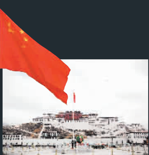
布達拉宮廣場第一次為平民下半旗誌哀。