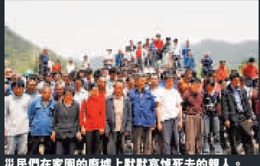
災民們在家園的廢墟上默默哀悼死去的親人。