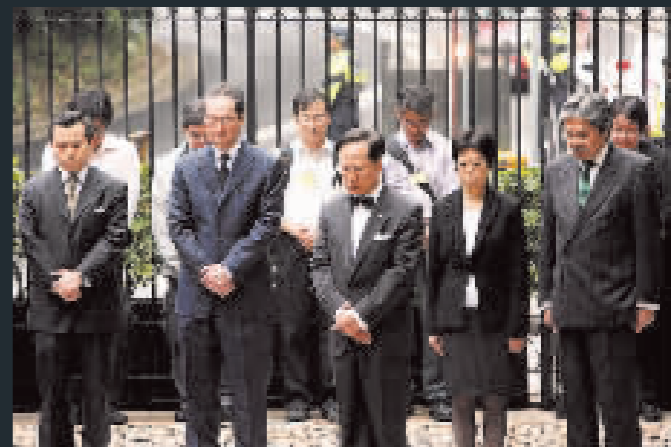
曾蔭權與唐英年、曾俊華等主要官員，在政府總部默哀三分鐘，對遇難災民表示深切哀悼。