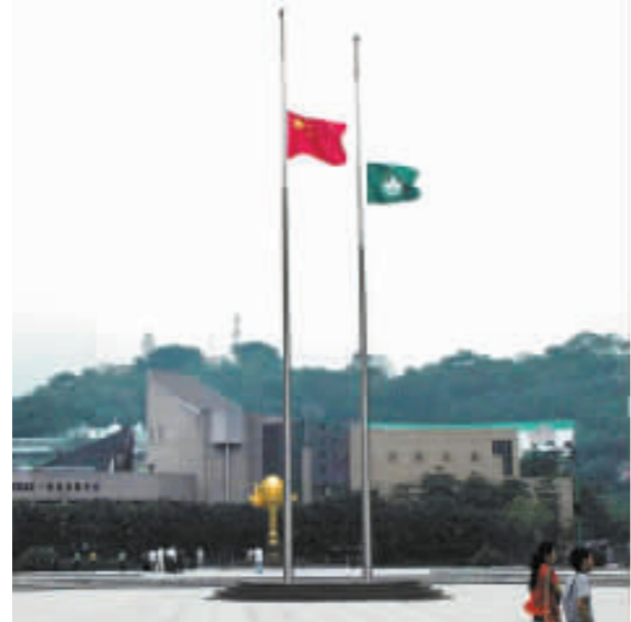
澳門金蓮花廣場在全國哀悼日下半旗誌哀。

【商報澳門專訊】昨日下午2時28分，澳門行政長官何厚鏞率領特區政府主要官員及局級人員，在政府總部為四川汶川大地震的罹難者肅立默哀3分鐘。何厚鏞在誌哀後表示，特區政府很多人員已自發性向四川地震中的死難者及受災同胞捐輸，希望各人今後繼續透過各自不同方式，慷慨捐輸，使受災同胞能盡快脫離痛苦、重建家園。他又要求政府部門嚴格按照中央規定，在此3日全國哀悼期間，暫停所有公共娛樂活動，以及所有具慶祝或喜慶性質的活動。此外，各公共機構、社團、學校昨日均下半旗致哀。在默哀3分鐘期間，汽車艦船鳴笛，以表達澳門居民對四川汶川大地震遇難同胞的深切哀悼；葡京賭場也參與默哀，全體員工和客人一齊默哀3分鐘。