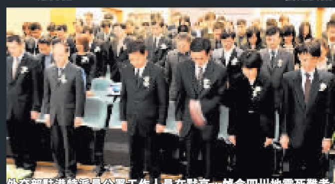
外交部駐港特派員公署工作人員在默哀，悼念四川地震死難者。

【商報專訊】記者周偉立、實習記者植穎姮報道：昨日下午2時28分，平日十分繁忙的香港鬧市突然一齊都慢下來，不少人靜默肅立，維港兩岸車船響號悲鳴，全港陷入哀悼四川大地震的遇難同胞的悲痛之中。或許悲慟感天，港九午後下了一場大雨，倍添哀思。