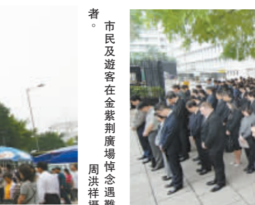
公務員下午於中區政府總部默哀三分鐘。