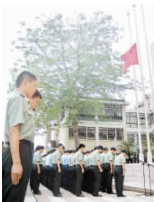
駐港部隊昨午2時28分為四川大地震死難者默哀3分鐘，各人神情哀傷。