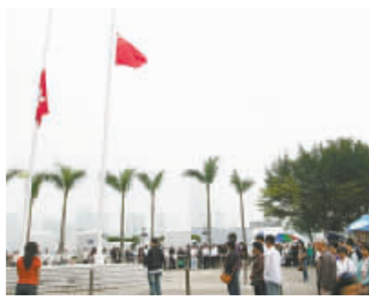
市民及遊客在金紫荊廣場悼念遇難者。