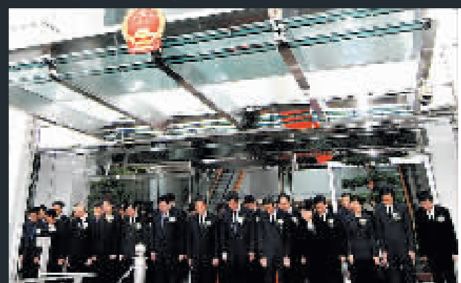
中聯辦主任高祀仁等默哀三分鐘，悼念四川大地震遇難同胞。