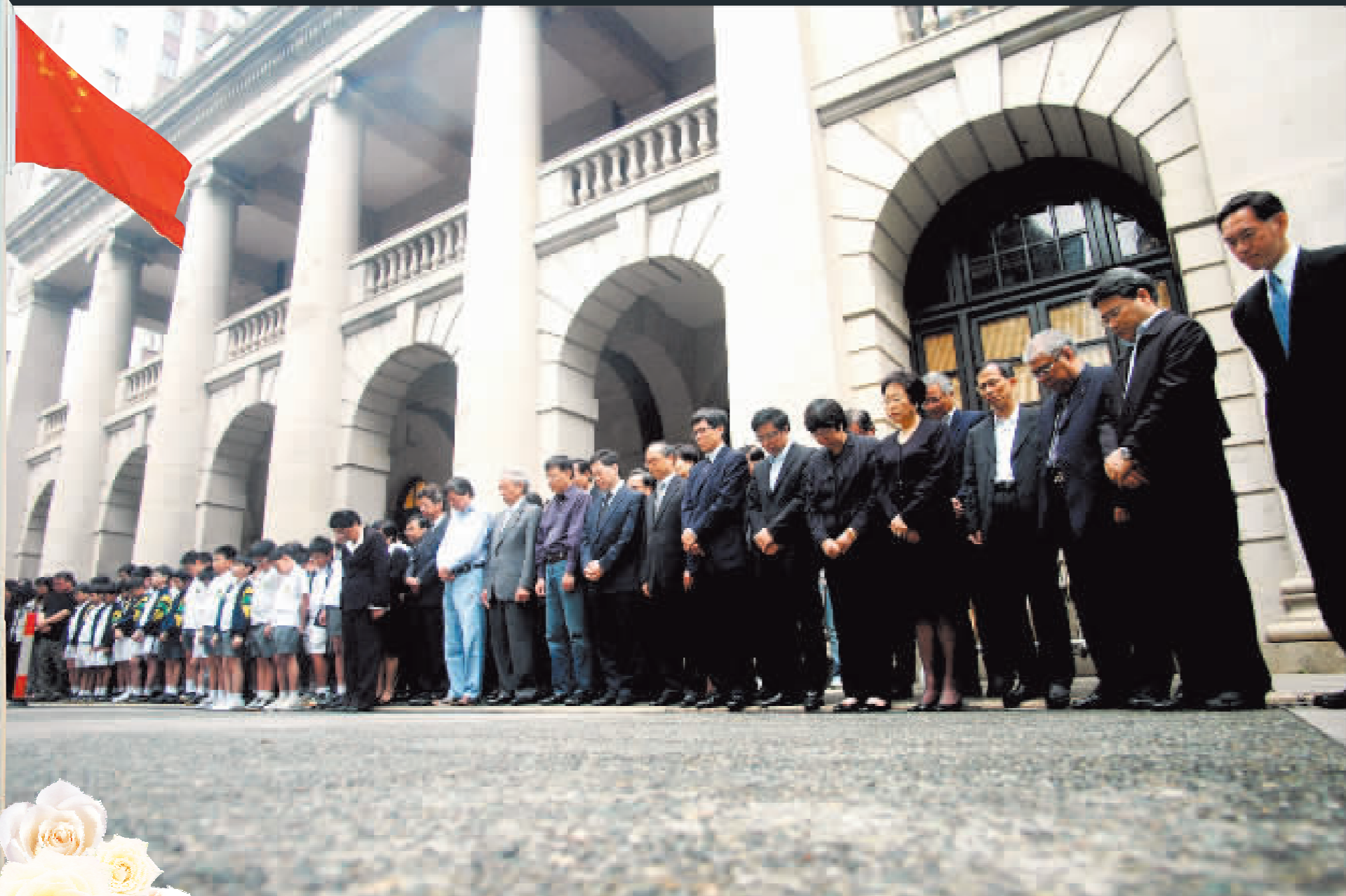
立法會議員聯同參觀立法會的小學生，一起哀悼地震死難者。