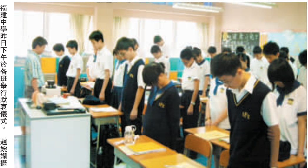
福建中學昨日下午於各班舉行默哀儀式。