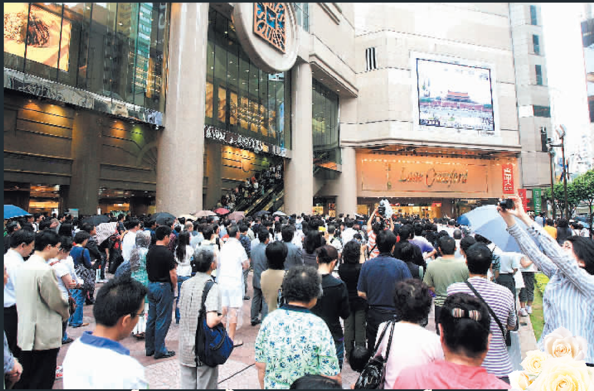
昨日下午2時28分，時代廣場眾多市民冒雨，停住匆忙的腳步，為地震遇難同胞低頭默哀。