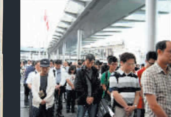
逾百市民在尖沙咀天星碼頭外哀悼地震死難者。

【商報專訊】記者何家驊報道：700萬人一條心，同為天府鳴哀笛。昨日下午2時28分，亦即四川大地震發生後剛滿一星期，本港的天空，灑着憐憫的細雨，全港市民在汽車、火車、輪船等連綿不絕的鳴笛響號聲下，垂首默哀3分鐘，向3萬多名罹難者致哀，與全國同胞同悲同哀。