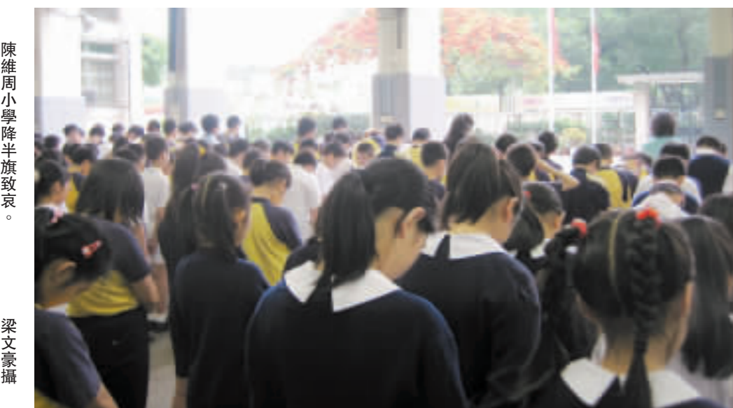
陳維周小學降半旗哀悼。