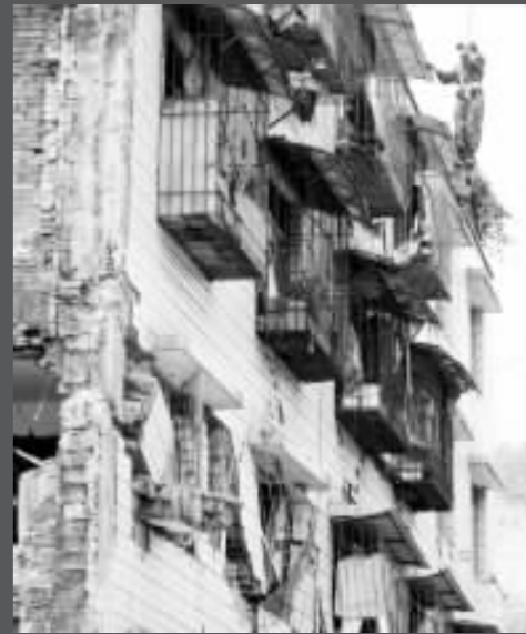
搜救人員高空作業，不放过任何一個角落。