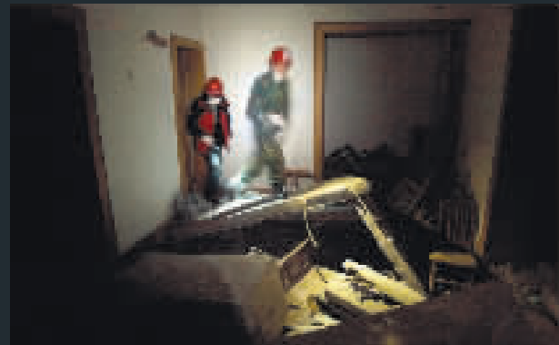
在北川，拯救人員在一間房間裏聽到聲音，於是入室搜索。