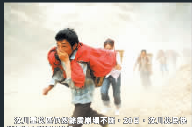
汶川重災區仍然餘震頻傳不斷，20日，汶川災民快速通過山體滑坡險段。