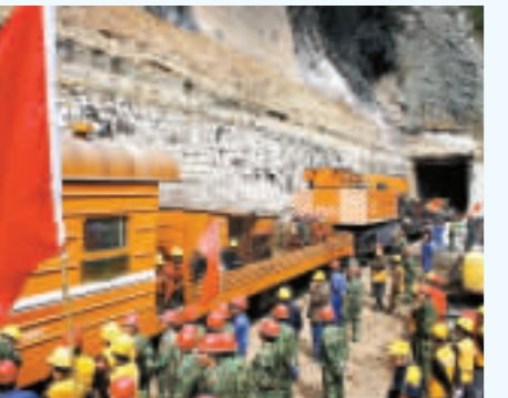
昨日，救援列車從洞內拖出最後三節被毀車輛。

【商報訊】鐵道部新聞發言人王勇平發布最新消息：截至昨日上午10時，搶險人員從寶成鐵路109號隧道中清理出全部車輛40節，搶險工作取得重大突破。汶川地震發生後，109號隧道被山體崩塌下的15萬方土石所掩埋。21043次貨物列車正好行駛在109號隧道中，貨物列車因此脫軌，12輛裝運汽油的罐車被埋在隧道中並起火燃燒，寶成線中斷行車。目前，根據搶險指揮部制定的「南北對攻、中間開花」搶險方案，現場正在進行隧道加固和更換損壞鋼軌和軌枕工作，在確保安全的前提下加快速度，力爭提前恢復寶成線暢通。