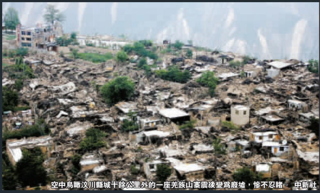
空中鳥瞰汶川縣城十餘公里外的一座羌族山寨震後變為廢墟，慘不忍睹。