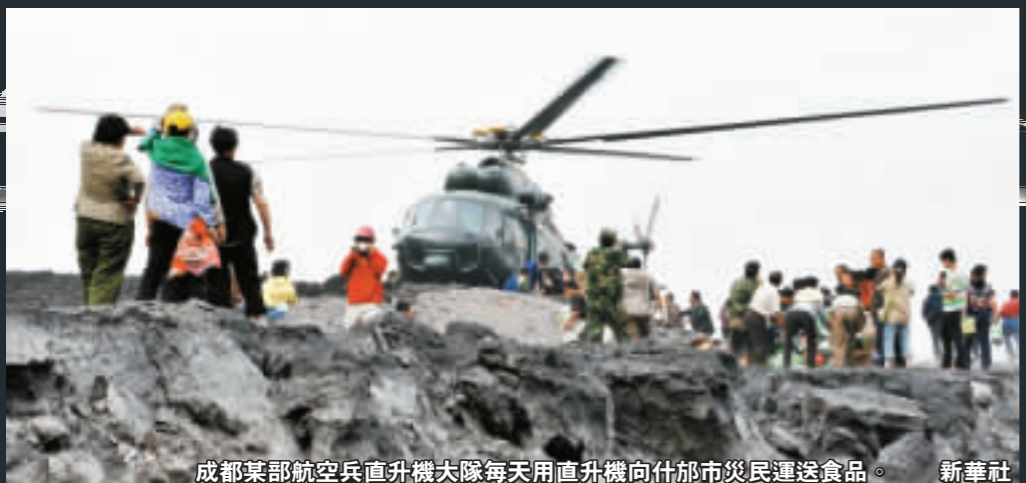
成都某部航空兵直升機大隊每天用直升機向什邡市災民運送食品。