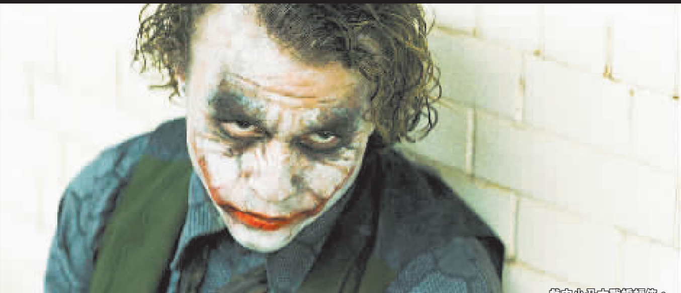
戲中小丑大戰蝙蝠俠。