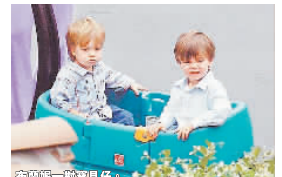
布蘭妮一對寶貝仔。

布蘭妮選擇不被兒子牽絆，重心放在工作上，經紀人賴瑞魯道夫說：「她在錄專輯很开心，這次與頂尖團隊合作，到目前為止表現讓我們很興奮。」布蘭妮日前替麥當娜拍攝世界巡迴MV，娜姐有意邀她一起巡迴，還打算撮合她和舊愛賈斯汀同台表演，刺激票房，但外界認為可能性不高。