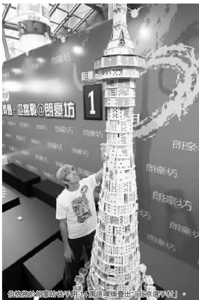
伯格將於朗豪坊徒手用14萬張牌牌疊出「北京選手村」。