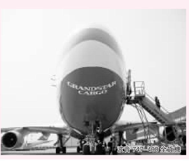
波音 747-400 全貨機

銀河國際貨運航空有限公司 (Grandstar Cargo) 使用波音 747-400 全貨機首航法蘭克福，正式投入營運。銀河國際貨運航空有限公司於 2007 年 12 月成立。公司的經營範圍包括國內和國際航空貨運運輸；飛機租賃、維修、包機；航空公司代理服務；進出口服務及相關地面服務，總部和營運基地設在天津。目前，公司已在歐洲、上海設立辦事處，並計劃進一步將分支機構擴展到世界各主要城市。繼使用第一架 B747-400F 首飛歐洲後，公司還計劃於 2008 年引進第二架 B747-400F 和兩架 A300-600F，並增設通往美國及其他城市的航線。