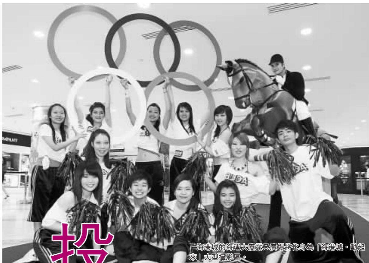
海港城的海運大廈露天廣場將化身為「海港城·動起來」大型攝影區。