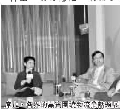
席上，各界的嘉賓圍繞物流業話題展開積極討論。

在星展企業銀行的全力推動下，新財經台早前於美麗華酒店舉辦中小企財智展商機。物流業新動向講座圓滿結束。香港物流業的趨勢，並探討中小企如何更有效地安排海外業務的資金以擴大業務範圍，出席的中小企代表就不同範疇的題目積極提問，現場反應熱烈，全場爆滿。