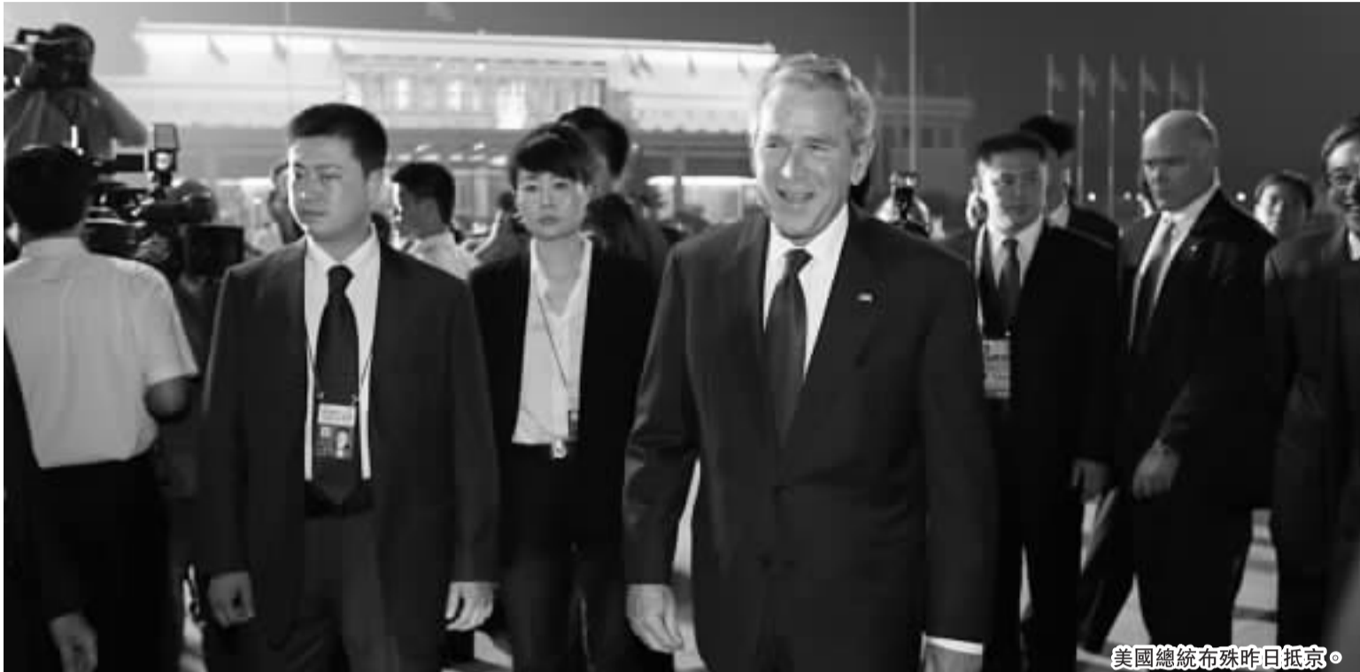
美國總統布殊昨日抵京。

同時，維安系統從各國元首進住北京後，已啟動一級戰備。消息人士說，鳥巢安全防範系統包括兩部分，即外圍安全防範跟內部安全防範。外圍主要是紅外線技術及感應電纜，從鳥巢外觀很難看出系統的存在。內部安全防範核心部分則是在場地內部裝置無數的紅外線微波探測儀。