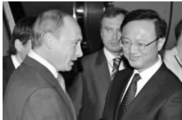
俄羅斯總理普京昨晚到達北京。