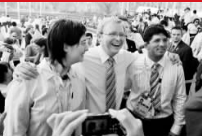
澳大利亞總理陸克文將出席今天的開幕式。