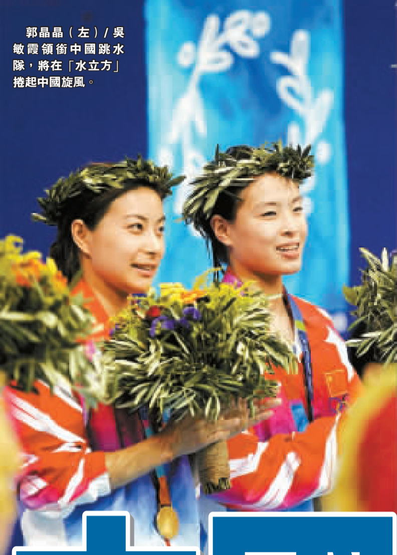
郭晶晶(左)/吳敏霞領銜中國跳水隊，將在「水立方」捲起中國旋風。