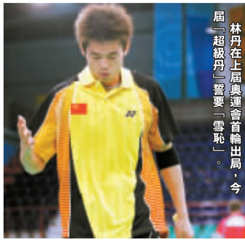
林丹在上屆奧運會首輪出局，今屆「超級丹」誓要「雪恥」。

中、美、俄三強逐鹿爭雄，這已是京奧不爭的態勢。美國隊實力強勁、俄羅斯哀兵血戰，呈反彈之勢；中國軍團借東道主之利，寸土必爭。 三家都不好惹，但體育競技就是實力爭鋒，此與彼落，且伯仲之間，偶然性極大，這既是規律使然，又是體育比賽的魅力所在，誰都在劫難逃。 三強之中，誰的態勢更有利些，誰又可以更多地借他人之力呢？首先來看看三強爭奪的態勢。 美俄大項不衝突 美國軍團的優勢在於游泳、田徑。雅典奧運會美國奪得12枚游泳金牌，8枚田徑金牌。其它14個項目上奪得15枚金牌。在本屆奧運會備戰過程中，美國隊在游泳甄選賽上接連打破世界紀錄，勢頭強勁，聲稱要在北京奧運會上奪走16枚游泳金牌。在去年的大阪田徑世錦賽上，美國人奪得14金，說明其看家的優勢項目上更為強勢。 俄羅斯在藝術體操、花樣游泳和摔跤項目上獨步天下。在射擊項目上也展現了極其強勢的面目。在2006年世錦賽上，俄羅斯隊在全部15項中獨取9金。其中，男子手槍