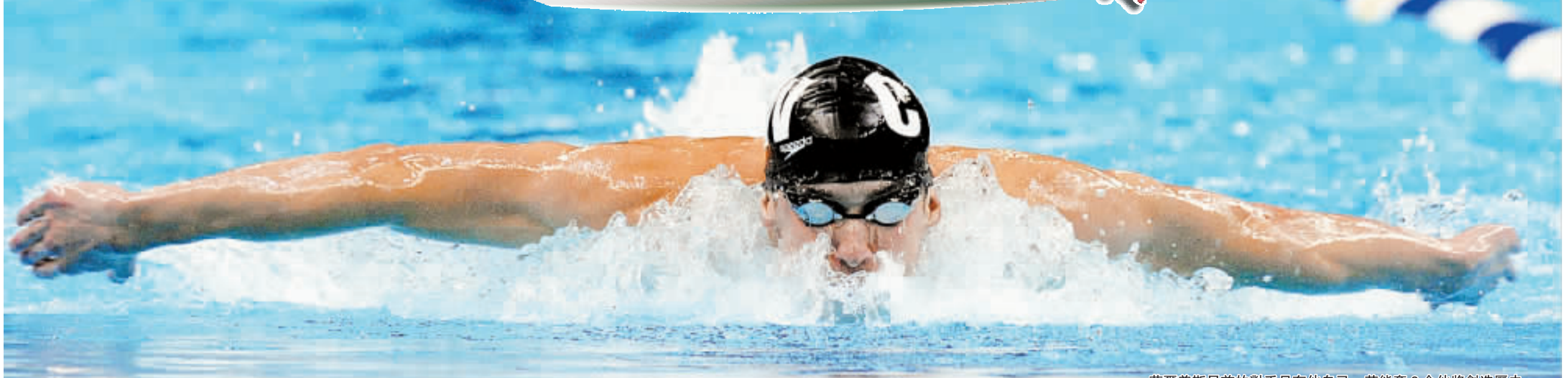
菲爾普斯目前的對手只有他自己，若能奪8金他將創造歷史。