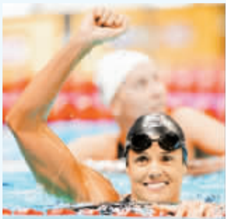
五次參加奧運本身就是個傳奇。