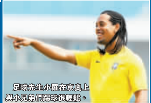
足球先生小羅在京奧與小兄弟們踢球很輕鬆。