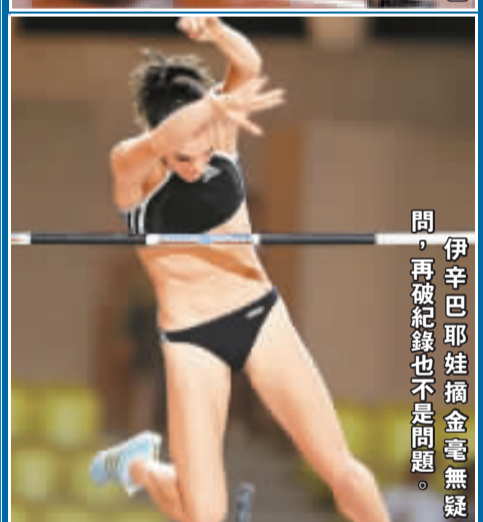
伊辛巴耶娃摘金毫無疑問，再破紀錄也不是問題。