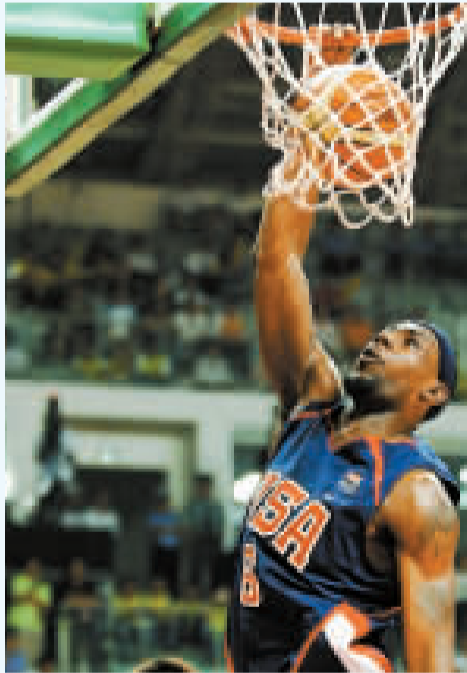
由科比、詹姆斯和韋德領銜的「夢八」，精彩的過程比賽金更值得期待。

八是老將是否真能寶刀不老。41歲的女子游泳選手洛佩茨是歷史上唯一5次參加奧運會的游泳選手，過去曾獲5枚奧運獎牌。39歲的塔爾米娜是奧運史上唯一一個跨越三個不同大項的女選手。她在1996年奧運會上獲得800米自由泳接力金牌，此後改行從事鐵人三項，參加過2000年和2004年奧運會。今年她將作為現代五項選手參加北京奧運會。