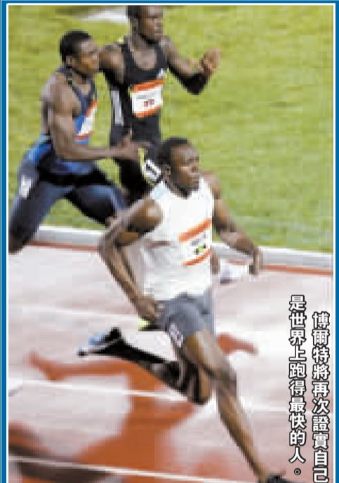
博爾特將再次證實自己是世界上跑得最快的人。

北島康介在雅典奧運會上獲得男子100米和200米蛙泳冠軍。這位「世界蛙王」在幾日前進行的訓練賽中，竟游出56秒97的100米蛙泳世界紀錄成績，這個成績比目前的世界紀錄快了2秒多。他以這種狀態出征京奧，不僅極有可能實現兩連冠的目標，觀眾還有望見證一項新的世界紀錄誕生。此前該項目的世界紀錄是59秒13。