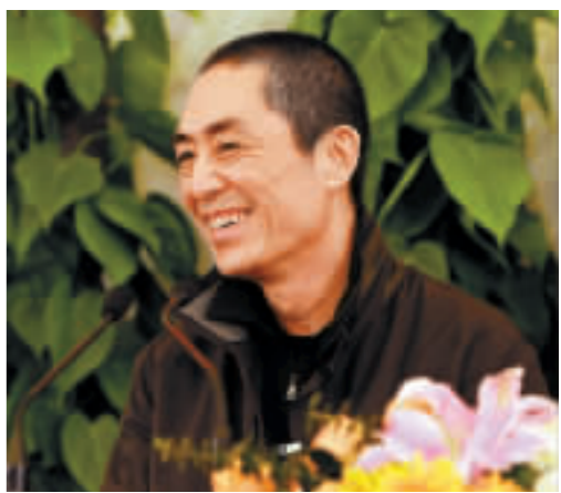
開幕式總導演張藝謀