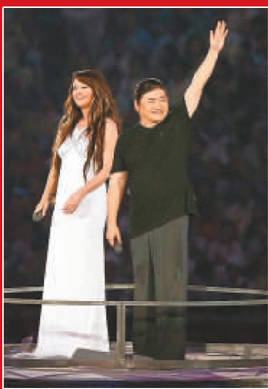
莎拉·布萊曼和劉歡一起演唱主題歌《我和你》。

還有一個需要披露的內幕就是，「23 號作品」本身的名字是《永遠一家人》，在確定為主題歌候選曲目後，改名為《我和你》。