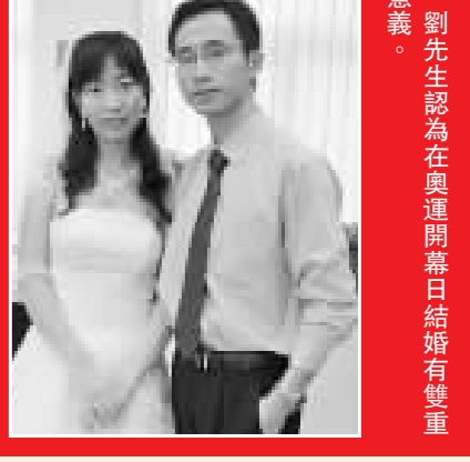
劉先生認為在奧運開幕日結婚有雙重意義。