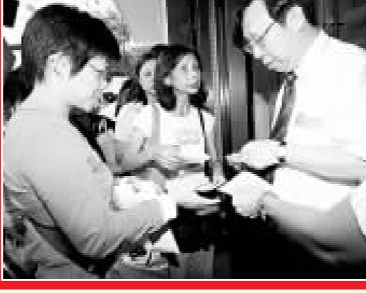
北京二〇〇八奧運會限量珍貴郵票冊及珍貴水晶座禮盒換購券，有百多名市民排隊索取換購券。