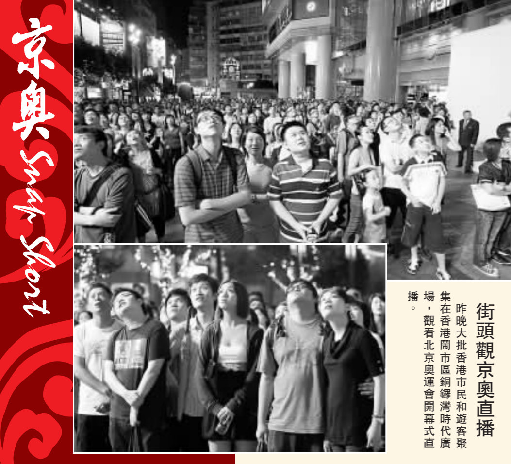
街頭觀京奧直播 昨晚大批香港市民和遊客聚集在香港銅鑼灣時代廣場，觀看北京奧運開幕典禮直播。