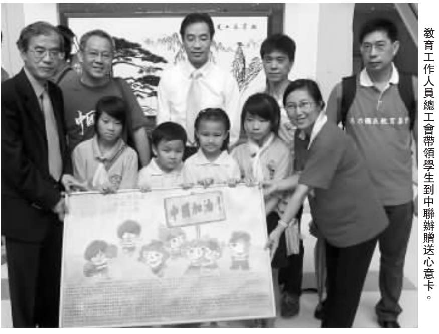
教育工作者總工會帶領學生到中聯辦贈送心意卡。

團隊內有多名小學生表示，希望劉翔可以贏得金牌；亦有學生希望郭晶晶贏得金牌，因為這是她最後一次參加奧運會；也有位同學表示，北京奧運會是盛事及香港協辦奧馬都是盛事，一定會觀看。