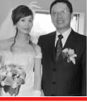
招生招太表示，他們是特別選擇奧運開幕的日子註冊結婚的。