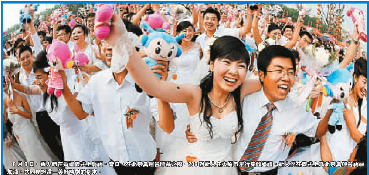
8月8日，新人們在婚禮儀式上慶祝。當日，在北京奧運會開幕之際，208對新人在太原市舉行集體婚禮。新人們在儀式上為北京奧運會祝福加油，共同見證這一美好時刻的到來。

深圳則有1155對新人登記結婚，是平時的近3倍。全市婚姻登記處工作人員早上提前兩個小時上班，有些登記處還推遲了下班時間。民政部門在首先滿足事先網上預約新人登記的前提下，也「破例」為許多沒有預約的新人登記，工作人員的心願只有一個，讓更多的新人享受「奧運會開幕，我結婚」的喜悅。