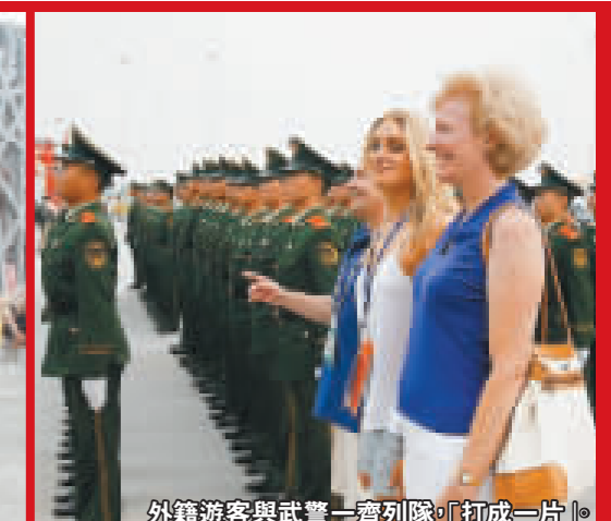
外籍遊客與武警一齊列隊「打成一片」。