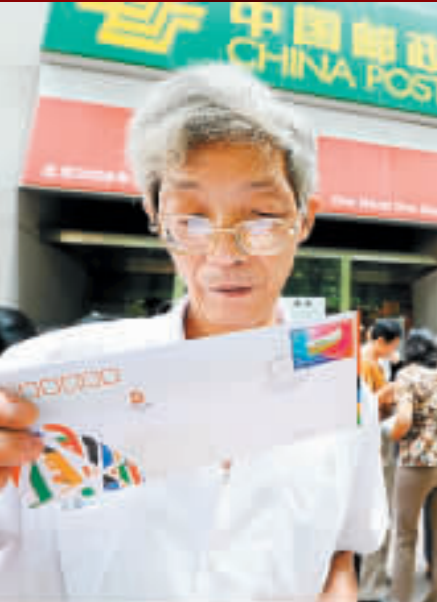
一名集郵愛好者在南京購買到貼有奧運紀念郵票的首日封。

【商報訊】北京二環邊上的一家郵局門前昨日排起長龍，許多北京市民期待著能買上一套開幕式紀念郵票。