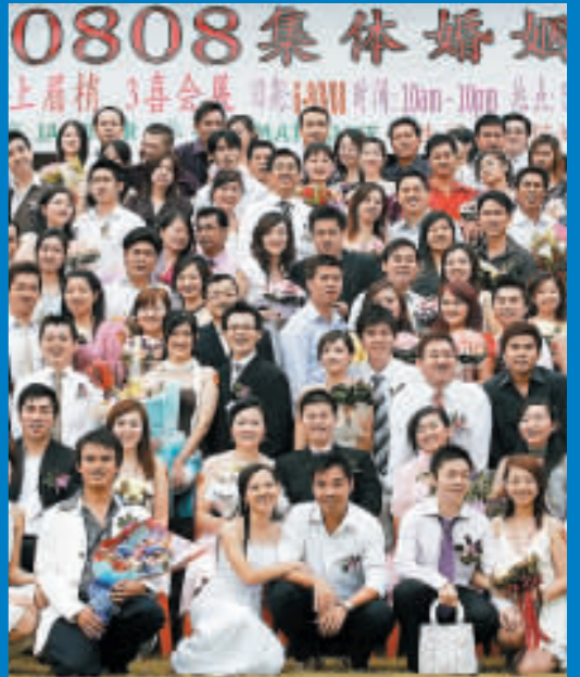
0808集体婚礼 在馬來西亞首都吉隆坡，238對馬來西亞華人新人選擇8月8日舉行了集體婚禮。圖為舉行集體婚禮的華人新郎和新娘合影。