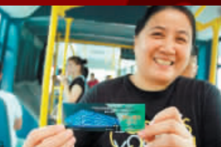
市民展示奧運會開幕普通紀念車票。

【商報訊】昨日，2008北京奧運會開幕普通紀念車票開始在北京市公共交通集團所屬的全部公交線路上發售，乘客在京乘坐公共車時可以購買。