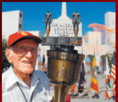
路易斯·贊帕瑞尼點燃1984年洛杉磯奧運會火炬，向京奧致敬。

【商報訊】當地時間7日上午（北京時間8日凌晨），在著名的洛杉磯紀念體育場前，洛杉磯市議員湯姆·拉邦吉主持儀式，代表洛杉磯市向即將開幕的第29屆北京奧運會致敬，並祝願北京奧運圓滿成功。 洛杉磯市議員湯姆·拉邦吉在致敬儀式上說，洛杉磯曾經兩次舉辦奧運會，他代表洛杉磯市向全體中國人民和全體北京市民衷心祝願北京奧運會成為歷史上最成功的奧運盛會，衷心祝願他們度過美好的16天。 在致敬儀式上，美國奧運傳奇人物、91歲高齡的路易斯·贊帕瑞尼親手點燃了1984年洛杉磯奧運會火炬，向即將開幕的北京奧運會致敬。 洛杉磯紀念體育場見證了中國實現百年奧運夢想的兩次重要事件：1932年，中國運動員劉長春首次在這裏參加奧運比賽；1984年，中國運動員許海峰首次奪得奧運金牌。