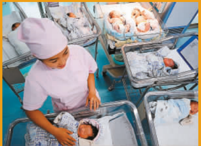
8月8日，在蘭州甘肅省婦幼保健院產科，醫務人員正在護理當天出生的嬰兒。