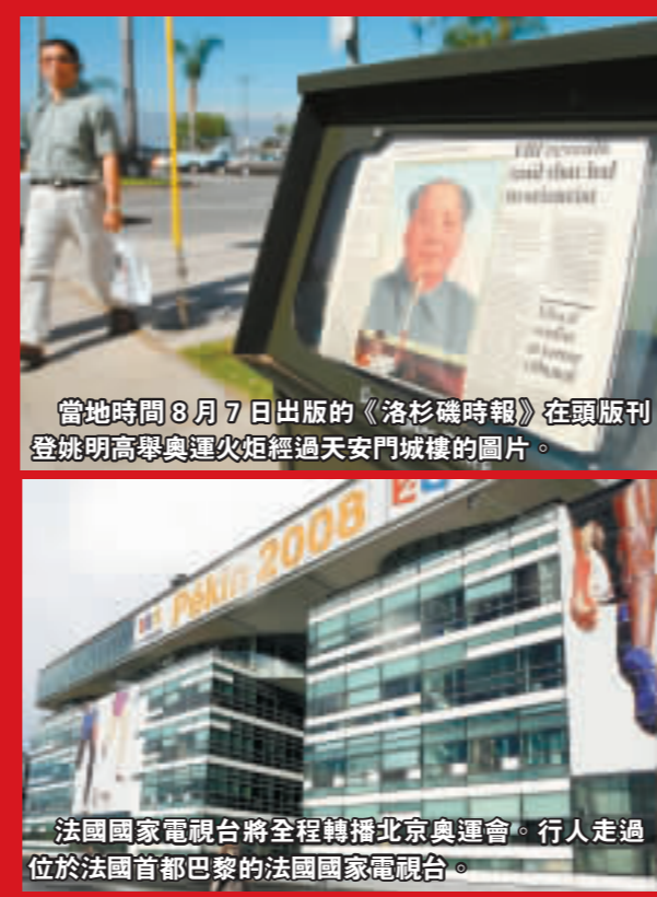
當地時間8月7日出版的《洛杉磯時報》在頭版刊登姚明高舉奧運火炬經過天安門城樓的圖片。

15時，該院病房樓十層的產科手術室的門關閉合。 據該院產科護士長介紹，截至14時，該院已有36名寶寶降生，院方預計8日將有50餘名「奧運寶寶」出生。 據悉，單在北京婦產專科醫院，八月份登記分娩的就有上千人，全年出生嬰兒將超過1300名。 有人口學家預測，若按年份來算，今年中國將有1800萬名「奧運寶寶」降生。