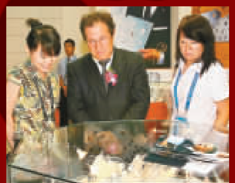
國際奧委會奧林匹克博物館館長加貝特與有興趣觀看由中國製造的2008年奧運會火炬接力紀念章。

【商報訊】全球首屆奧林匹克博覽會8日在北京展覽館開幕，這次歷時10天的博覽會以郵品、徽章、錢幣等展覽為主，包括23個國家的奧運郵品逾千個展櫃及瑞士奧林匹克博物館的珍貴藏品。