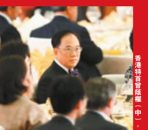
香港特首曾蔭權(中)