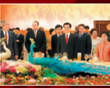
菜式中西合璧，設計頗具奧運特色。