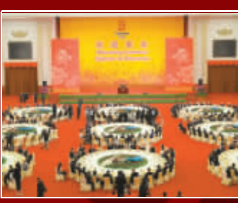
九桌國宴，喜迎貴賓。