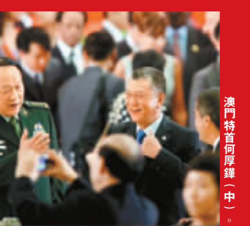
澳門特首何厚錕(中)