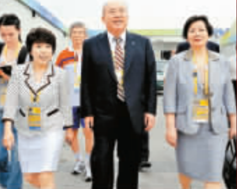
吳伯雄一行在乒乓球名將鄧亞萍的陪同下參觀奧運村。

【商報訊】中國國民黨主席吳伯雄昨日到北京奧運村看望中華台北奧運代表團成員。上午10時左右，吳伯雄一行來到奧運村，受到了奧運村村長陳至立的歡迎。並在奧運村村長辦公室副主任鄧亞萍的陪同下，參觀了奧運村。吳伯雄認為，奧運村的環境很好，並衷心祝福北京奧運會圓滿成功。吳伯雄還向鄧亞萍詢問本次奧運會哪些項目的票賣得最好，並表示，昨天北京奧運會的開幕式令他終身難忘，很震撼。