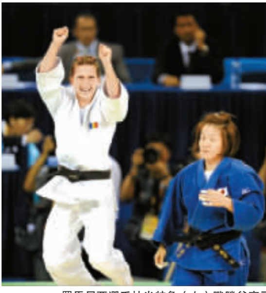
羅馬尼亞選手杜米特魯(左)戰勝谷亮子。