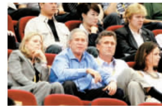
觀看美國女籃比賽。