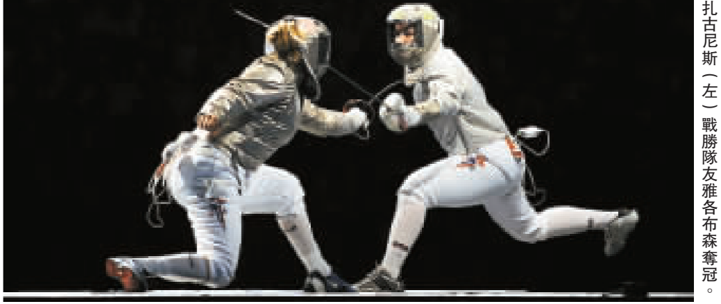
扎古尼斯(左)戰勝隊友雅各布森奪冠。

【商報北京專訊】特派採訪組報道：昨日，奧運會擊劍女子佩劍個人比賽完全成了美國人的天下。美國隊「三劍客」一枝獨秀，扎古尼斯、雅各布森和沃德分獲金銀銅牌。而扎古尼斯的金牌也是美國拿下的第一面金牌。 「三劍客」世界排名都在前五，超強的實力讓人難以望其項背，在比賽中的發揮更是淋漓盡致。 俄羅斯選手拿利卡亞是闖入四強的唯一一位非美國選手，但在最後一劍可惜惜敗。