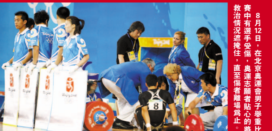
8月12日，在北京奧運會男子舉重比賽中有選手受傷，奧運志願者貼心的將救治情況遞掩住，直至傷者離場為止。