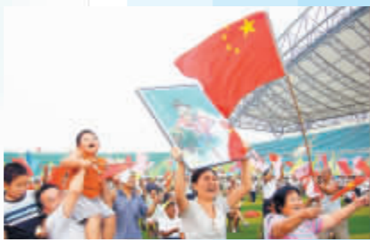
在劉春紅的家鄉山東省招遠市，鄉親們聚集在體育場慶祝劉春紅奪冠。