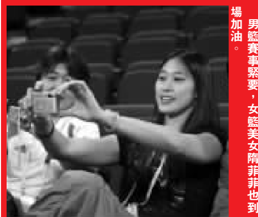
男籃賽事緊要，女籃美女陪非非也到場加油。

【商報訊】14日20時，京奧男排A組小組賽在首都體育館進行，中國男排經過2小時零2分鐘的鏖戰，最終以3：2險勝日本男排，五局的比分依次是25-20、25-23、17-25、16-25和15-10。