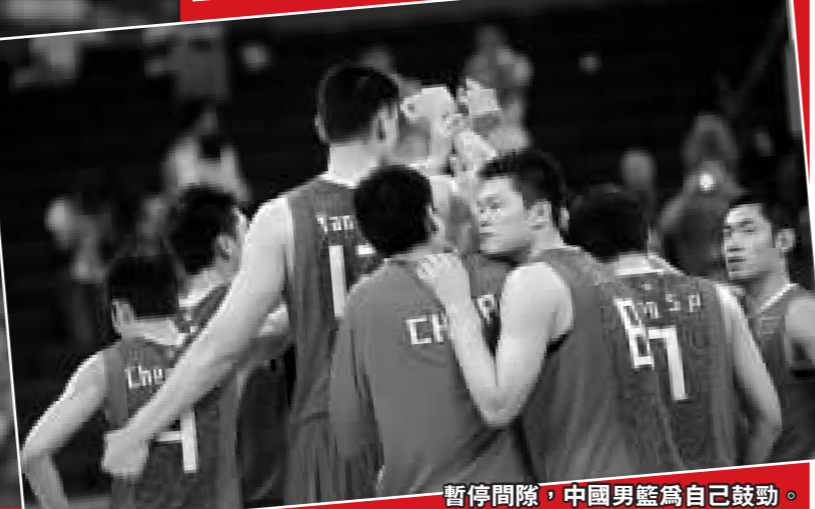
暫停間隙，中國男籃為自己鼓勁。