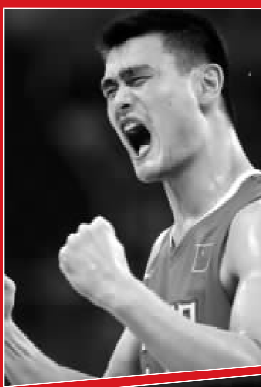
握拳一吼，小巨人對自己的表現甚是滿意。