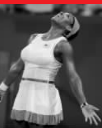
網壇名將小威廉姆斯昨日告負，無緣決賽。