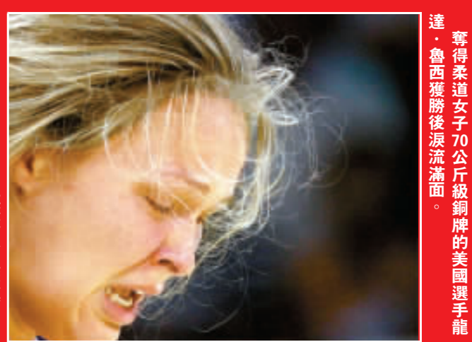
奪得柔道女子70公斤級銅牌的美國選手龍達·魯西獲勝後淚流滿面。