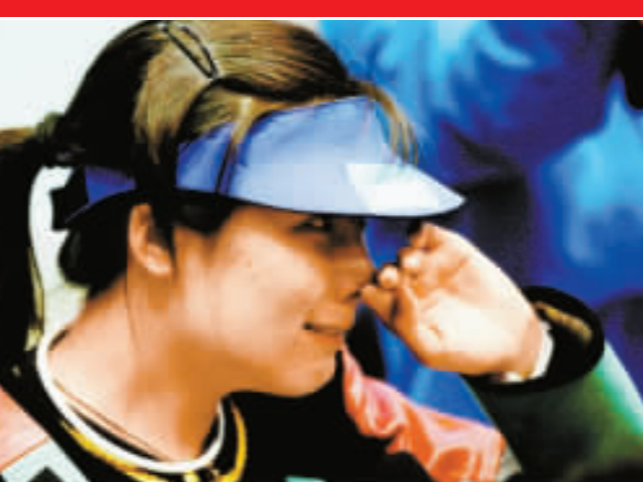
杜麗摘金淚灑賽場。