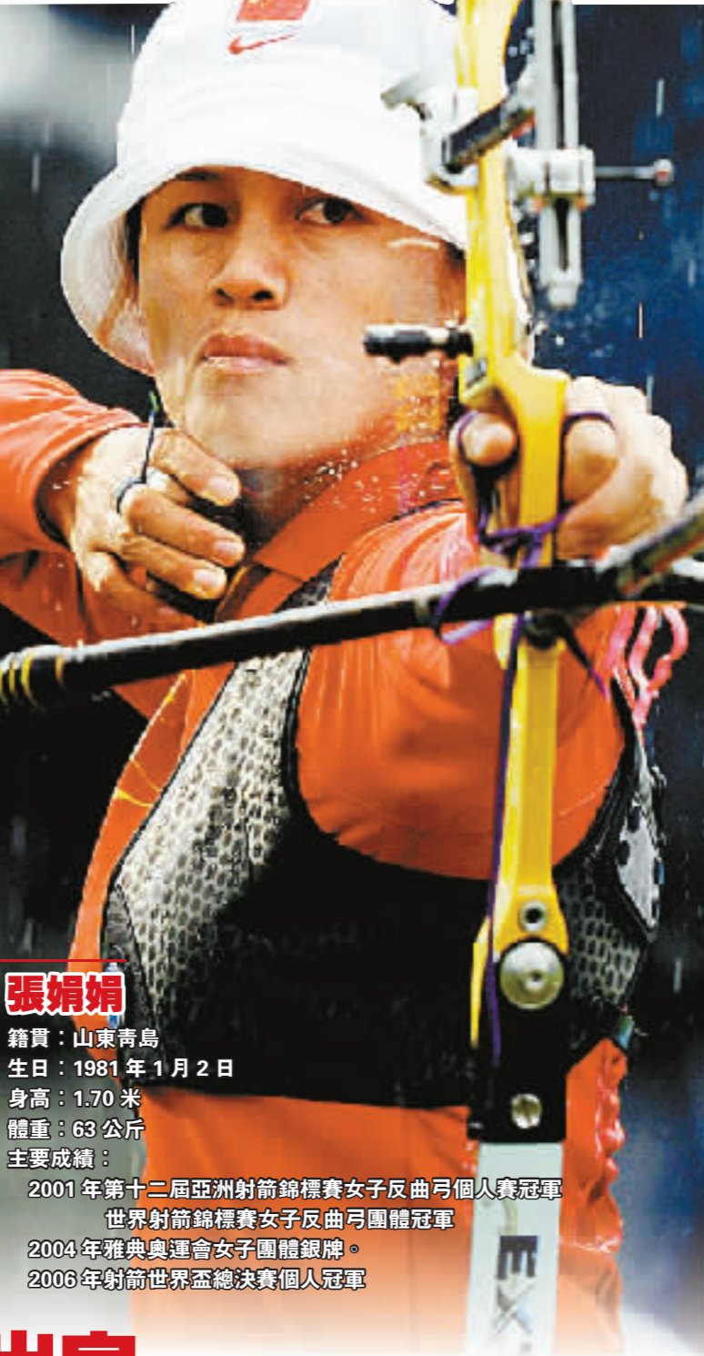
張娟娟 籍貫：山東青島 生日：1981年1月2日 身高：1.70米 體重：63公斤 主要成績： 2001年第十二屆亞洲射箭錦標賽女子反曲弓個人賽冠軍 世界射箭錦標賽女子反曲弓團體冠軍 2004年雅典奧運會女子團體銀牌 2006年射箭世界盃總決賽個人冠軍