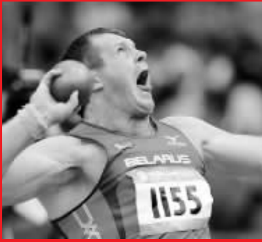
白俄羅斯選手帕維爾·雷任在男子鉛球及格賽中擲球。