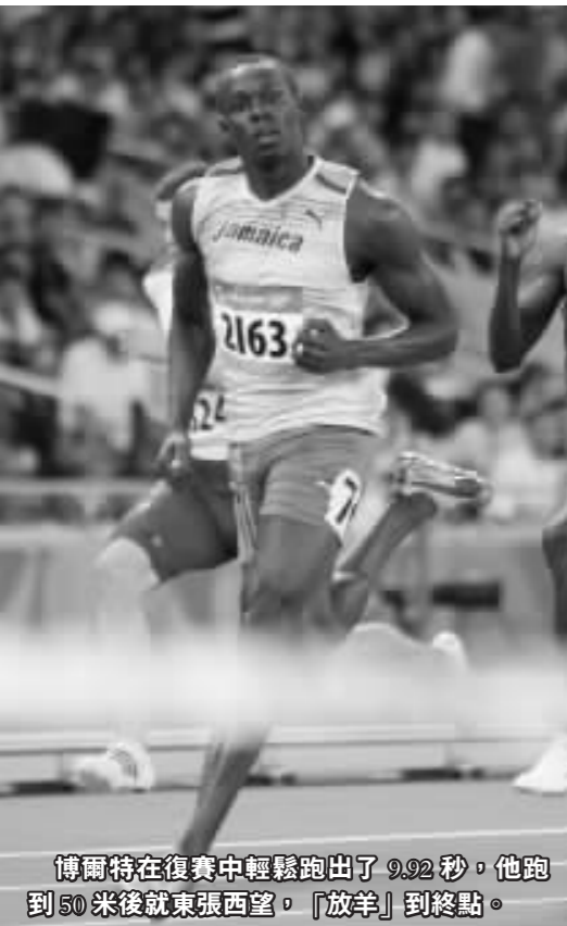
博爾特在復賽中輕鬆跑出了9.92秒，他跑到50米後就東張西望，「放羊」到終點。

【商報訊】15日上午和晚間，京奧男子百米跑進行了前兩輪比賽。儘管北京田徑賽場天氣悶熱，但男子百米世界紀錄保持者尤塞恩·博爾特15日跑進四分之一決賽卻沒流多少汗。