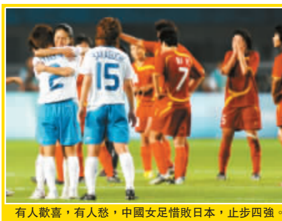
有人歡喜，有人愁，中國女足惜敗日本，止步四強。