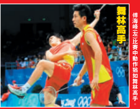
傅海峰左比賽中動作猶如舞林高手。