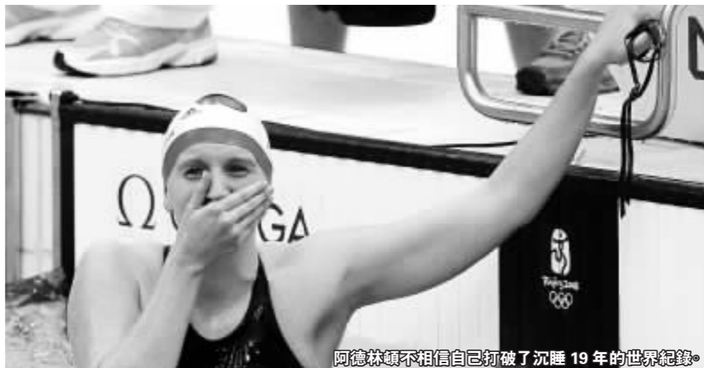
阿德林頓不相信自已打破了沉睡19年的世界紀錄。