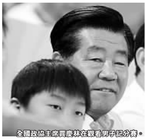
全國政協主席賈慶林在觀看男子記分賽。

【商報北京專訊】特派採訪組報道：香港單車選手黃金寶昨日出征自行車男子記分賽，最終取得5分，位居第15名。