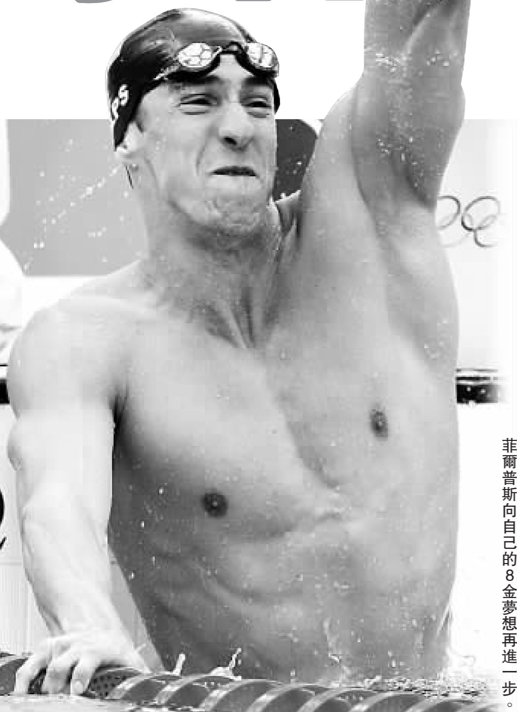
菲爾普斯向自己的8金夢想再進一步。