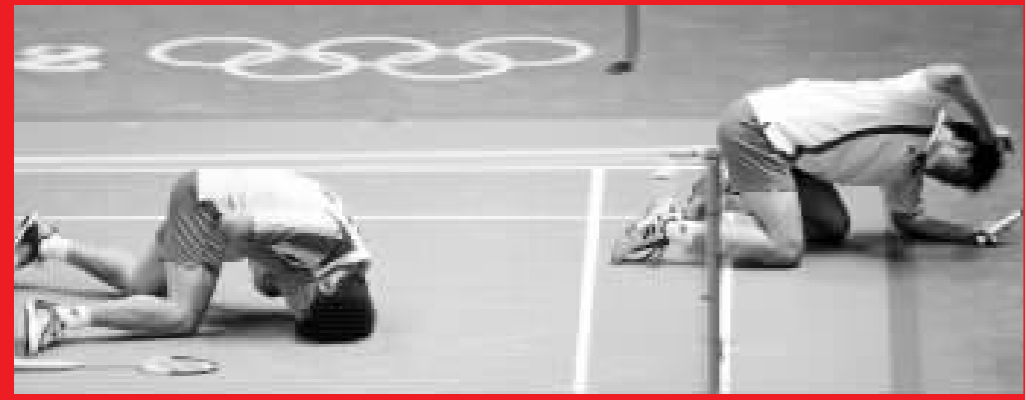
韓國羽毛球男雙選手獲得銅牌喜極而跪。

她曾向裁判投訴5次也無法降低觀眾的聲浪，最後輸給自己的心理擊敗，「最傷心的是，我只發揮了三成水平。」但她也坦承自己未能好好控制好心理。