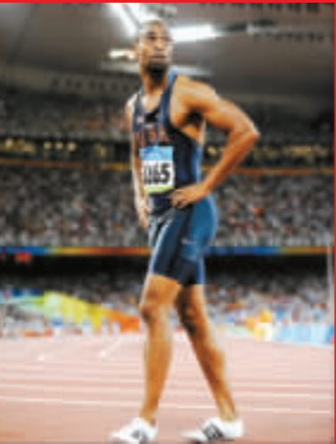
蓋伊在百米半決賽早出局，自己都一臉茫然。