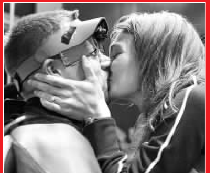
槍手夫妻情深一吻。