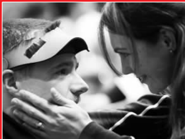
埃蒙斯在妻子面前流淚，卡特琳娜給予安慰。