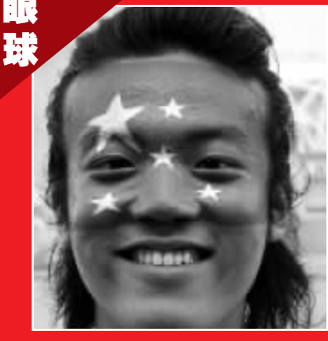
男青年面涂國旗祝福中國軍團