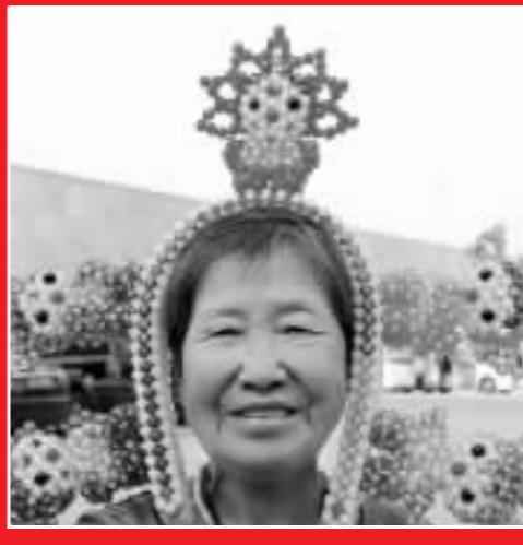
老太頭戴五彩福娃亮相「水立方」