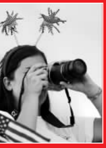
「頭上輔助設備」對焦賽場