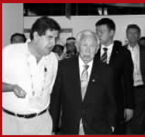
前主席薩馬蘭奇昨天下午來到 MPC 先後參觀了埃菲社和西班牙奧委會的工作間。

劉岩是奧運會開幕式「絲路」段落A角。7月27日在排練奧運會開幕式時，由於意外，致使她從三米高的高空墜落到軌道上，嚴重受傷。開幕式後，張藝謀已率導演組人員到醫院探望過她並承認對她的受傷負有責任。