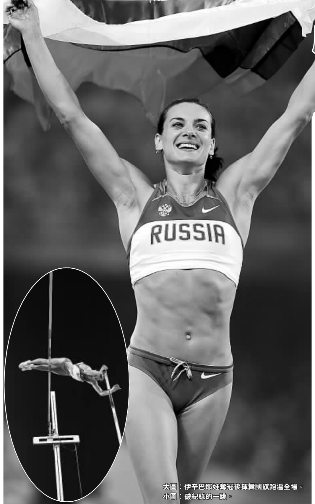
大圖：伊辛巴耶娃奪冠後揮舞國旗跑遍全場。小圖：破紀錄的一跳。