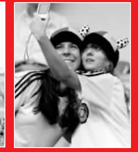
球迷迷相機記錄美好瞬間