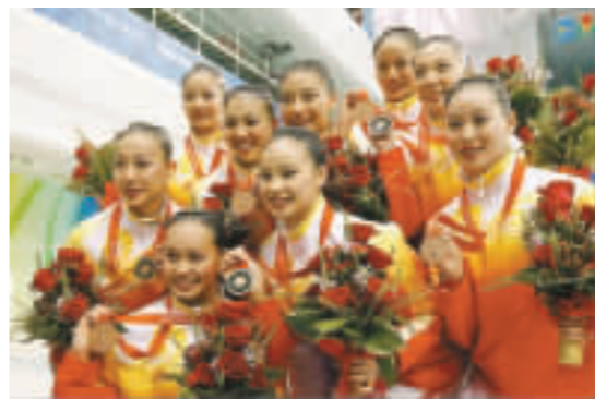
中國姑娘摘銅開心。