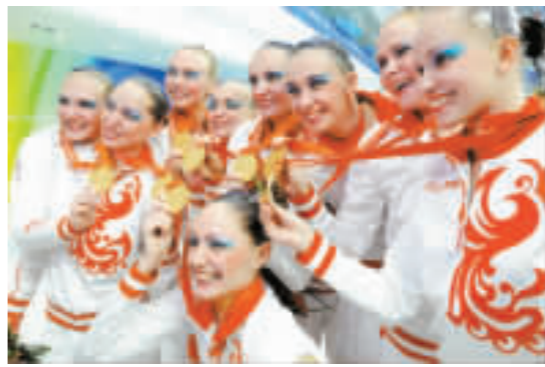
俄羅斯隊成功衛冕冠軍。

中國花樣游泳隊在2004年雅典奧運會上獲得集體項目第6名，但自從日本籍「花游教母」井村雅代執教中國隊後，中國花樣游泳有了很大的進步。