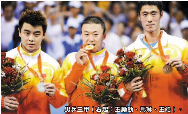
男乒三甲(右起：王勵勤、馬琳、王皓)。