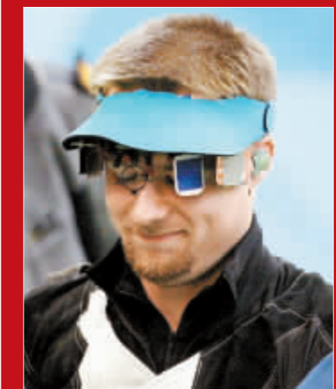
又是最後一槍射失，埃蒙斯徒嘆奈何。

24 年前，她是中國首枚擊劍金牌獲得者。24 年後，年近半百的她神奇地出現在奧運賽場。樂菊傑在女子花劍晉級 16 強時，高舉「祖國好」的橫幅向中國觀眾問好。儘管此次她代表加拿大參賽，但這一刻，沒有國界，只有感動。