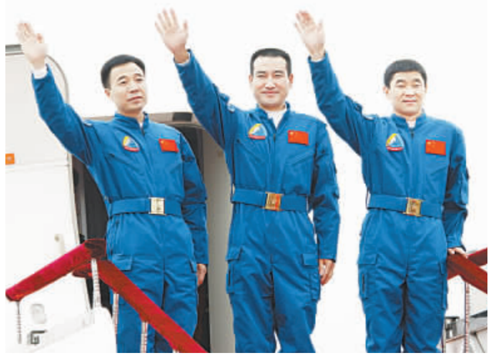
翟志剛(中)、劉伯明和景海鵬(右)完成征空任務後，乘專機回到北京時向歡迎者揮手致謝。

不過，在進入太空實驗室乃至空間站建設階段後，要進行大量科學實驗，因此需要從科學家中選拔航天員。屆時，香港、澳門的科學家，將獲得進入太空的機會。