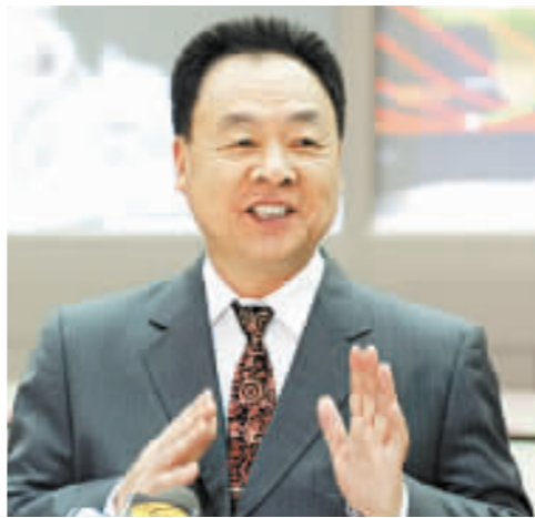
中國載人航天工程副總指揮張建啓稱，2012年後港澳科學家有望上太空。

在訪港最後一天即周一，代表團將在灣仔伊利沙伯體育館與香港學生展開真情對話。教育局已向全港250間中小學派發入場券，邀請師生參加與三位航天員的對話會。教育局發言人表示，2400多張入場券約五分之三為小學索取，其餘是中學生以及兩間特殊學校。報名情況相當踴躍，很快就滿額。