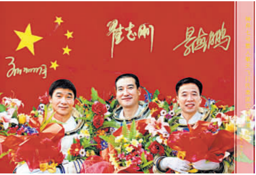
神七三雄向出席晚宴嘉賓和在機場迎接的學生代表送贈的親筆簽名合照。