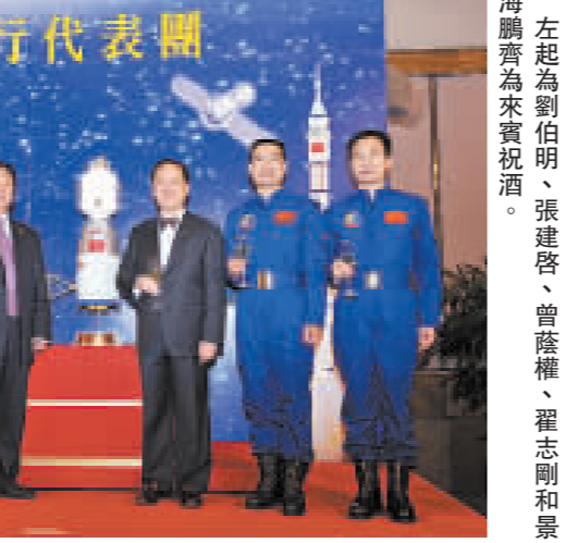
左起為劉伯明、張建啓、曾蔭權、翟志剛和景海鵬為來賓祝酒。

代表團團長、中國載人航天工程副總指揮張建啓表示，是次他們一來香港，就陷入歡樂的海洋，可見香港同胞和祖國人民的心是連在一起的，他感謝香港市民對他們的盛情歡迎。