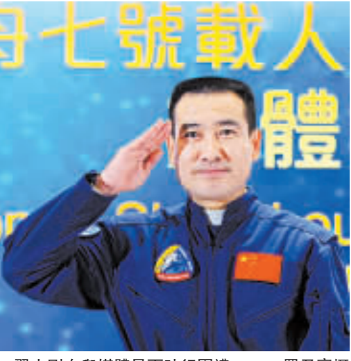
翟志剛在與媒體見面時行軍禮。

神七航天代表團昨午到港稍作休息後，下午隨即在入住的紅磡海逸酒店會見傳媒。在代表團團長張建啓的帶領下，3位航天英雄翟志剛、劉伯明和景海鵬身穿藍色整齊航天制服，笑容可掬地步入場地，台下迅即掀起哄動。 成為中國步出太空第一人的翟志剛一開腔就帶來驚喜。他首先以廣東話說「大家好」、「香港」，引起台下如雷掌聲。他說，載人航天工程是一個龐大且複雜的系統工程，每一項成就都經歷着幾代航天科技工作者的不懈奮鬥、拚搏創新的結晶。他謙稱，自己純屬航天隊伍中一名普通隊員，能夠代表祖國和人民執行飛行任務，感到非常光榮和自豪。他笑言自己沒有特點，認為「只要肯付出，真正投入進攻，終會有回報」，更以中國「飛得最高、走得最快」航天員的身份，祝願香港明天更好，祖國更繁榮富強，再次博得台下連串掌聲。