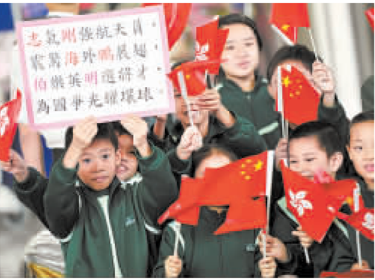
學生代表作詩歡迎神七英雄蒞港。

他又說，空間實驗室等實驗性任務較多階段方有較適合女性的工作，屆時將會挑選合適的女航天員。計劃在官方網站內上載最新的研究和課題，有助港人方便、靈活地了解最新情況。