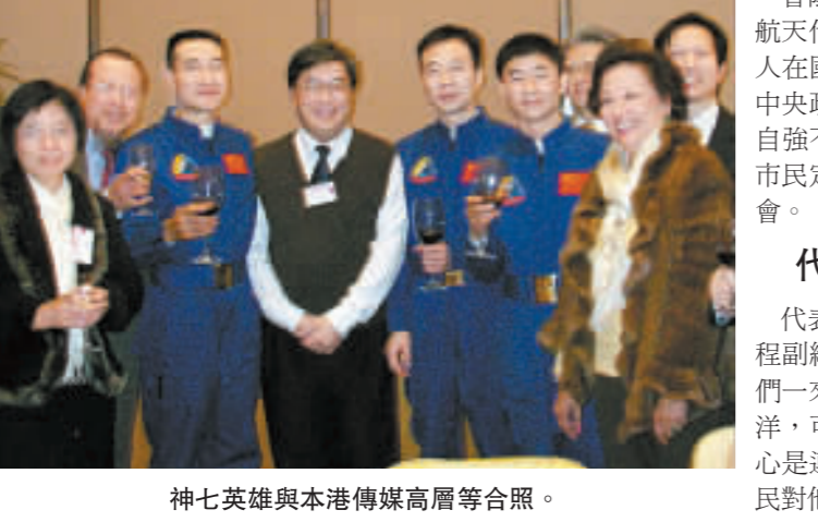
神七英雄與本港傳媒高層等合照。

他說，今年是國家不平凡的一年，從奪取抗震救災的全面勝利，成功舉辦奧運，到「神七」升空，譜寫了中華民族的偉大篇章。在這個歷程中，都有香港特區政府和市民的熱情支持和關心，他相信香港這顆祖國的明珠將更加奪目。 隨後，曾蔭權致送一個寫上「神舟升空、壯志凌雲」的紀念瓷碟給代表團；訪問團團長、中國載人航天工程副總指揮張建啓則回贈一隻「神七」模型。 晚宴開始前，播放了一段有關「神舟七號」升空及太空漫步的精華片段。其後曾蔭權、張建啓聯同三位航天員翟志剛、劉伯明和景海鵬向晚宴嘉賓祝酒。 出席晚宴的嘉賓約360人，包括特區政府官員、中央政府駐港機構代表、政界、商界和其他社會各界人士。