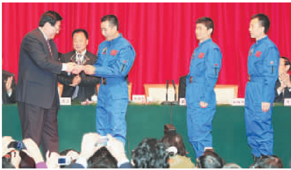
榮穩定提供了新的精神動力和寶貴財富。 翟志剛：榮耀屬於人民

高祀仁說，從「神五」到「神七」，廣大航天員在長期奮鬥中所形成的特別能吃苦、特別能戰鬥、特別能攻關、特別能奉獻的載人航天精神，不僅為全國各族人民沿着中國特色社會主義道路奮勇前進增添了精神力量，也為我們推進「一國兩制」偉大實踐、維護香港長期繁