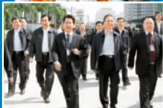
去年11月，溫家寶總理在深考察高新技術企業。