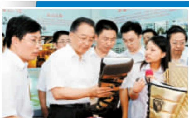
溫家寶總理半年来兩次親臨廣東視察。圖為2008年7月，溫家寶在東莞考察中小企業。