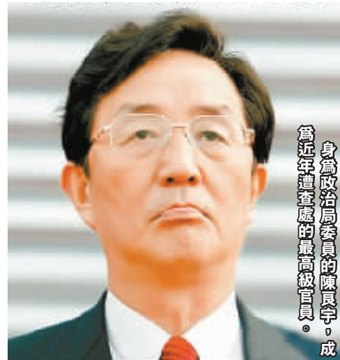
身為政治局委員的陳良宇，成為近年遭查處的最高級官員。

馬里海域進發，這是600年前鄭和下西洋後中國艦隊再度出征遠洋。 國人希望，面對改革開放30年的成就與挑戰，中國這艘巨輪也能夠重新啟航，繼續向著民主、富強、開放、文明的方向前進。