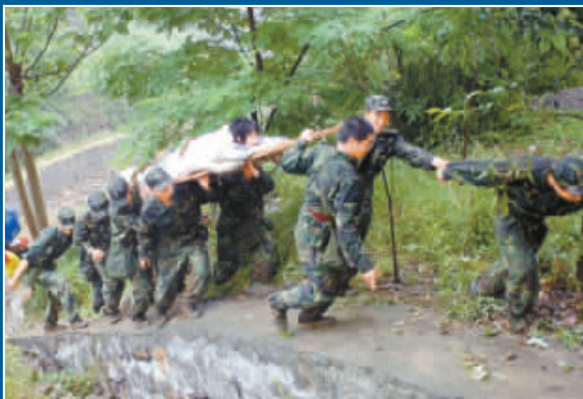
5月13日，救災人員奮力將一名地震傷員抬往山上的安全地帶。