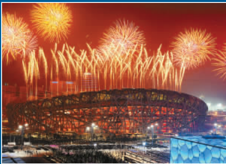
京奧美輪美奐的開幕式。