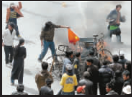
3.14拉薩騷亂中，破壞分子打砸搶之餘，還在大街上焚燒國旗。