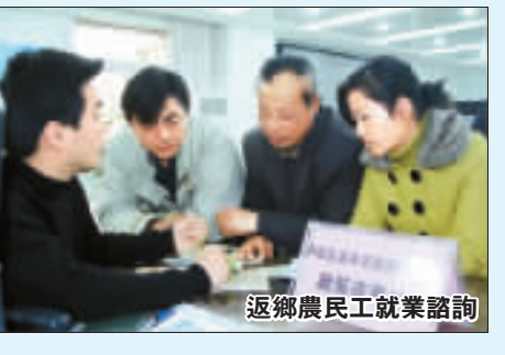
返鄉農民工就業諮詢

打造「首善廬陽」，民生先行，民生工程亦要創新。作為安徽省唯一的「城市低保示範區」，廬陽區在紮實推進城市低保工作同時，早在2005年就在安徽省率先出台了農村最低生活保障辦法，將全省農村家庭中人均收入低於1000元的貧困人口納入農村低保，率先在全省實現了「應保盡保」。 藥價虛高如「頑疾」，而廬陽卻迎難而上，率先在全省探索了破解藥價虛高這一「頑疾」的改革之路，實施「藥品集中採購、統一配送和收支兩條線」兩項改革試點，讓社區衛生服務機構將藥品的利潤讓利