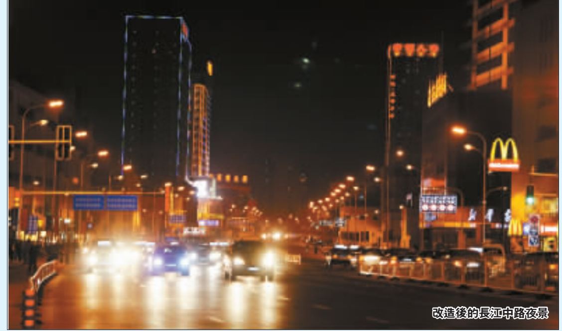
改造後的長江中路夜景

隨着城市主幹道的改擴建，廬陽老城區路網已從以往的「十」字形骨架變成「井」字形布局，城市框架進一步拉開，城市形象明顯提升。隨着大建設的不斷深入，廬陽區由單純的道路拆遷轉為道路與項目拆遷並重，多個城市綜合體項目、商業地產項目建設快速推進，廬陽區的「商業航母」地位將得到進一步鞏固和提升，一個蘊藏千億商機的新動感廬陽正在逐漸裂變形成。