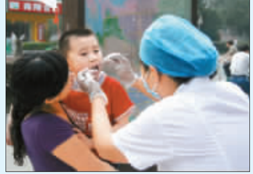
醫務工作者街頭義診