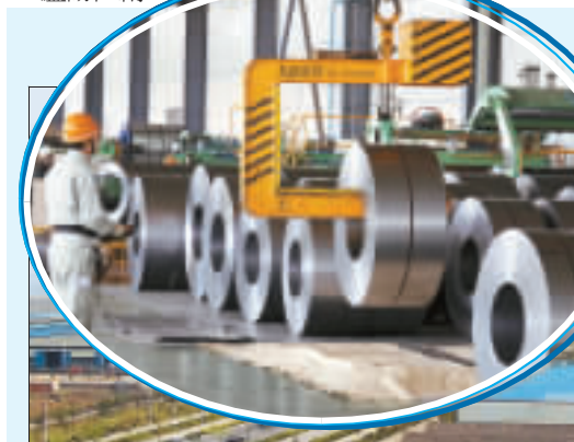
安徵寶鋼鋼材配選有限公司

新工業發展思路，以循環經濟實現園區發展的新突破。成立僅三年的合肥廬陽工業區於2006年被安徽省發改委批准為合肥市唯一一家循環經濟園區建設試點，在全市省級開發區中率先通過ISO質量 and 環境「雙認證」，同時成為安徽省出版印刷產業基地。目前，廬陽工業區正按照循環經濟理念，嚴格篩選項目，已吸引天威保變集團、上海寶鋼、杭州信雅達公司等105個項目入園，形成了機械電子加工、鋼材剪切精加工、出版印刷三大產業。企業之間產品能配套、廢物能循環，這降低了企業成本，促進工業區高速發展。2008年工業區規上工業企業完成總產值61.9億元，增長72.6%，佔全區總量的63.2%。 伴隨著一些新項目的引進以及高強度的投入，廬陽工業經濟發展的後勁大大增強，從而為全區經濟跨越式發展提供了強有力的支撐。（商報記者：龔舒斌、包蕾 通訊員：劉曉峰、馬娜、鄭良寶）