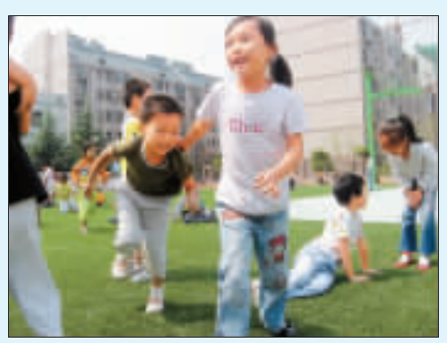
海棠花園小學一年級新生快樂嬉戲

給居民群眾。目前該區已在8個社區衛生服務中心和10個社會衛生服務站實施，試點兩個月共擠掉藥品價格水分21萬元。 就業是民生之本。為解決「零就業家庭」問題、打造「充分就業城區」，廬陽區創新再就業工程工作思路，開辦了安徽省首家創業服務大廳。2008年8月，創業服務大廳正式使用，600多個創業項目「虛席以待」，讓擁有「老閩夢」的合肥市民們，在全省率先享受到勞動保障部門提供的「一條龍」式創業服務。自2005年廬陽區實施民生工程以來，廬陽區財政每年民生工程的支出都要翻一番，2008年，民生工程投入更是達到8626萬元。同時，該區還對城鄉醫療救助、農村居民最低生活保障、農村「五保戶」供養、社區衛生服務體系建設、貧困白內障患者復明、農村計劃生育家庭獎勵扶助等十餘項民生工程，提高了保障標準，擴大了實施範圍，嚴格實行「一把手」負責制，做到主要領導親自抓，分管領導具體抓，真正把好事辦實、把實事辦好。 有新思路、大投入做保證，廬陽區在打造「首善之區」的道路上越走越堅定。