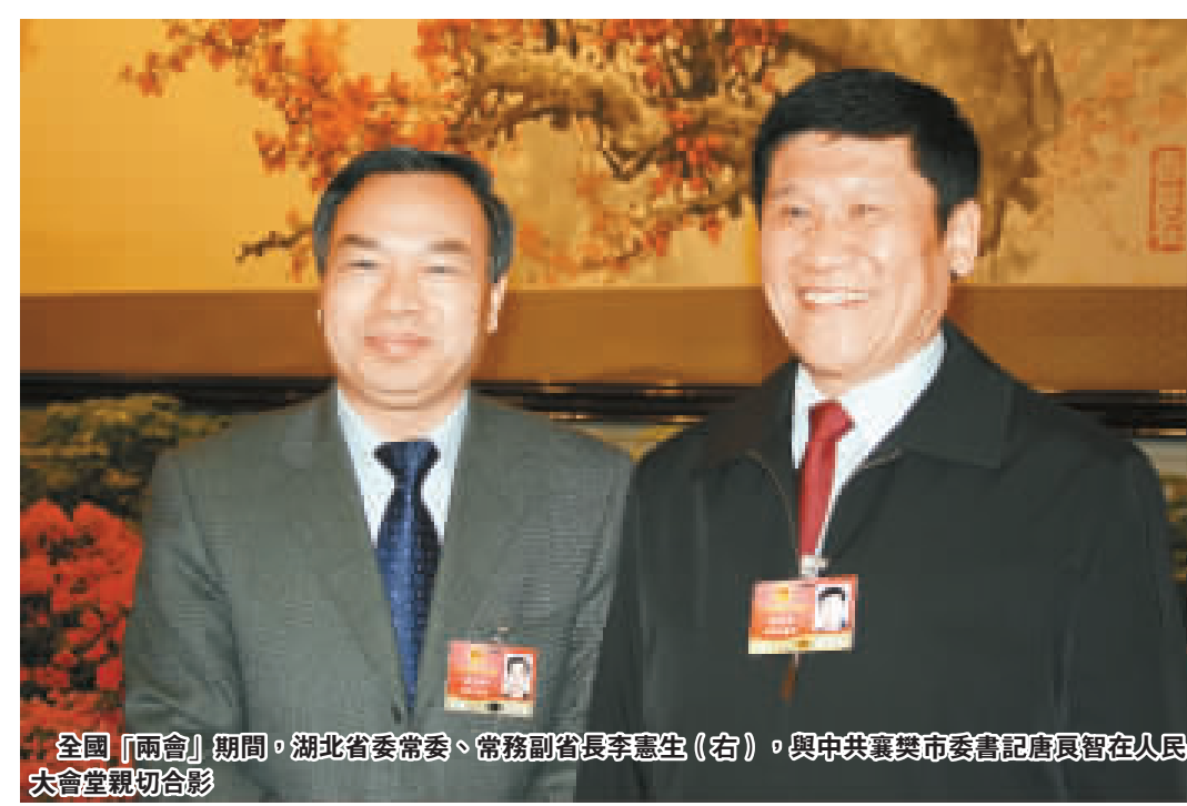
全國「兩會」期間，湖北省委常委、常務副省長李鴻忠（右）與中共襄樊市委書記唐良智在人民大會堂親切合影

白駒過隙，歷史的巨輪悄悄碾過。隨著前輩留下的車轍，襄樊再次大步向前。 正如鄧小平同志南巡講話帶來改革春風一樣，湖北省委、省政府建設襄樊為省域副中心城市的戰略使襄樊如沐春風。 「襄樊應該再次樹黨頭角了！」面對崛起的機遇，襄樊人對未來充滿希望。 這股希望來自於蓬勃的信心。曾經的襄樊，聚集了大批國有重點工業企業；曾經的襄樊，在上個世紀70年代就生產出了數字控制線型切齒機；曾經的襄樊，造出了湖北省第一台電視機…… 能力越大，責任越大。在中部崛起的大環境下，東有武漢城市圈這個城市群，西南有宜昌這個知名水電之都，發展鄂西北的重任自然落到了襄樊身上。 中共湖北省委書記羅清泉、省長李鴻忠，多次視察襄樊，並對襄樊發展充滿期望。「襄樊是省重要的工業基地，交通優勢明顯，文化積澱深厚，經過近幾年發展已具備較好基礎。目前，中央進一步加大對中部地區的支持力度，襄樊比照享受振興東北老工業基地政策，南浦、保康兩個山區縣比照享受西部大開發政策，省委、省政府將襄樊列為省域副中心城市予以重點支持，襄樊完全有條件、有能力發展得更好一些、更快一些！」 改革開放的總設計師鄧小平同志曾多次強調：「改革開放的膽子要大一些，敢於試驗，看準了的，就大膽地試，大膽地闖。」襄樊要實現跨越式發展，就需要這樣的精神！ 「在改革開放的大潮中行舟，不進則退，少進亦退！」中共襄樊市委書記唐良智認為，目前襄樊的首要任務就是：「增強危機感，自加壓，著眼全省、放眼全國，解放思想，促進自身發展。」