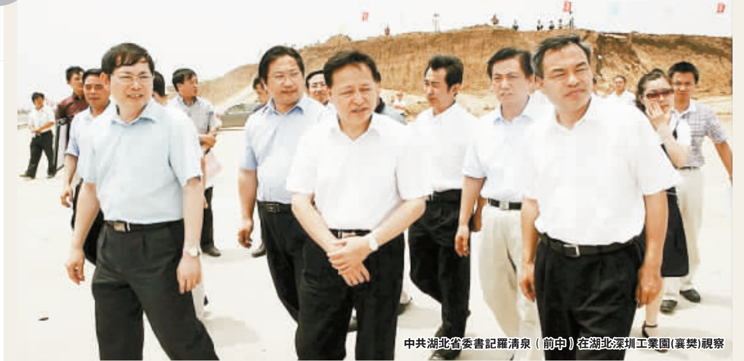
中共湖北省委書記羅清泉（前中）在湖北深州工業園（襄樊）視察

「襄樊的發展不夠，關鍵是工業發展不快。」一位長期研究湖北區域經濟的專家曾這樣指出：襄樊經濟結構性矛盾突出，一相對於汽車產業，其他產業實力較薄弱，大企業不多；縣域經濟薄弱，7個縣市區工業增加值占全市的比重不足三分之一。 面對「病症」，曾長期主持中國「光谷」工作的襄樊市委書記唐良智再次顯示了銳意改革和發展的魄力。他指出，襄樊要實現省域副中心城市的目標，必須打造百億產業；通過三五年努力，促使汽車產業產銷過千億元，紡織、食品、電力、電子、冶金和醫藥化工等六大產業過百億元，與襄樊一道跳起「雙龍舞步」。 如同襄樊不能單純依靠自身發展一樣，改革開放的排頭兵——深圳同樣需要藉助「外力」。 創造了中國工業化、城市化和現代化奇跡的深圳，正面臨著土地、空間有限、能源、水資源短缺、人口不堪重負等問題，環境承载力嚴重透支難以為繼，而要突破這些瓶頸的制約，必須深入貫徹科學發展觀，為深圳企業開拓物理發展空間、市場開發空間和資本擴張空間尋找新平台、新載體。 毫無疑問，襄樊就是最好的平台和載體之一。 數字最能說明問題，唐良智對比了襄樊高新區和上海寶山區投資成本，一個佔地100畝、投資1.4億元工業項目，在襄樊可減少100次性徵地費4000萬元，年可節約電費600萬元、水費200萬元、天然氣費8萬元、工資支出2000萬元，減少企業所得稅50%。 以主動的姿態承接東部產業轉移，唐良智表示，