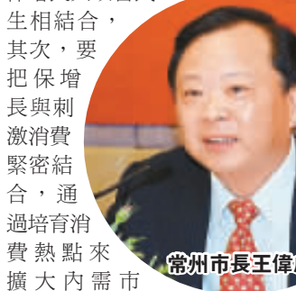
常州市市長王偉成

全國人大代表、常州市市長王偉成說，常州落實「保增長、促發展」這一任務，要做到「五個結合」。首先是保增長與改善民生相結合，其次，要把保增長與刺激消費緊密結合，通過培育消費熱點來擴大內需市場。第三，要把保增長與調整結構緊密結合，通過實施五大產業振興計劃來實現產業優化升級。常州還要把保增長與科技創新緊密結合，通過打造三級科技創新創業平台來提升區域創新能力；把保增長與激活企業緊密結合，通過改善政府服務，為企業創造一個應對金融危機的良好外部環境。