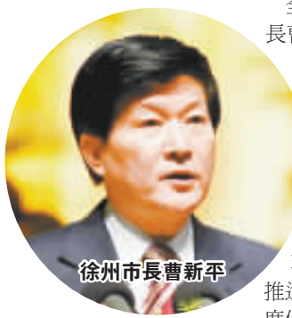
徐州市市長曹新平

全國人大代表、徐州市市長曹新平代表說，面對新的形勢，面對「兩會」提出的保持經濟平穩較快發展的首要任務，徐州將緊緊抓住省委、省政府振興徐州老工業基地的戰略機遇，積極破解經濟運行中出現的矛盾和問題，加快推進經濟轉型升級，加大力度保障改善民生，努力跑出「徐州加速度」。今年徐州將著力做好三件大事：繼續振興老工業基地、改造棚戶區、綜合治理採煤塌陷地。在老工業基地振興方面，徐州已對目標任務進行了分解，今年將著重發展以太陽能、多晶硅為代表的新興產業，工程機械為代表的裝備製造業，農產品深加工等為代表的食品及副食品加工業，以及商貿物流和旅遊業等四大產業。