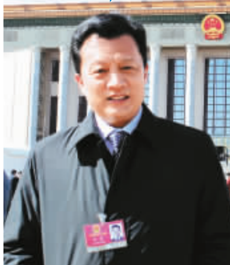
江蘇鹽城市市長李強

作為世界上第一個野生麋鹿保護區和國家級珍禽（丹頂鶴）自然保護區的鹽城，具有獨特的生態保護環境，且多年來鹽城一直在將建設生態濕地和經濟發展放在全市工作的首要位置。值全國兩會期間，記者採訪了鹽城市市長李強。李強說，目前鹽城的發展正面臨著一個千載難逢的歷史性機遇，鹽城有著最具有特色的生態環境，沿海的特色資源條件具有極高的開發利用價值，將來鹽城一定會成為江蘇乃至全國沿海新型產業的發展基地。