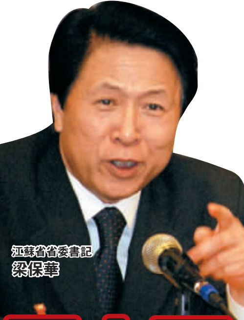
江蘇省委書記 梁保華

3月7日下午，十一屆全國人大二次會議江蘇代表團全體會議在人民大會堂舉行。金融危機下，東部經濟強省江蘇的舉措和方案無疑成為媒體關注的焦點。除本報外，來自新華社、人民日報、中央電視台和英國路透社、日本朝日新聞、美國彭博新聞社、新聞週刊等103家境內外媒體的148位記者到場旁聽和採訪。