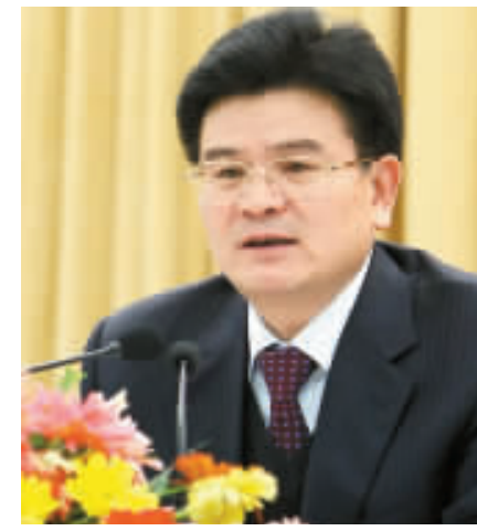
江西省發改委主任姚木根

姚木根提出，一定要通過建設鄱陽湖生態經濟區，使這個流域的開發成為全國各大流域開發的典範。為此，江西抓了五個方面的工作：一是在所有的縣市開工建設污水處理設施；二是實施「一