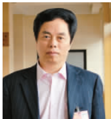
波司登集團董事長高德康

大四小」綠化工程；三是抓好「五河一湖」源頭治理工程；四是實施新增百億斤優質稻穀生產能力工程；五是啓動鄱陽湖水利樞紐工程的前期工作。