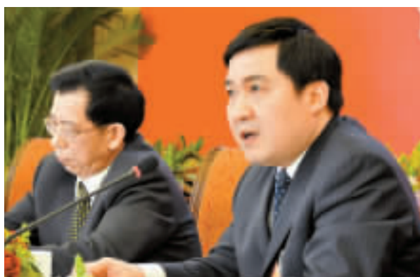
嘉興市長李衛寧在兩會上發言

【商報北京專訊】記者謝國平報道：兩會期間，全國人大代表、嘉興市長李衛寧在京接受本報記者專訪。李衛寧解讀總理工作報告，結合目前經濟形勢，從「保增長、促轉型、抓統籌、重民生」的角度談論了嘉興的科學發展觀。