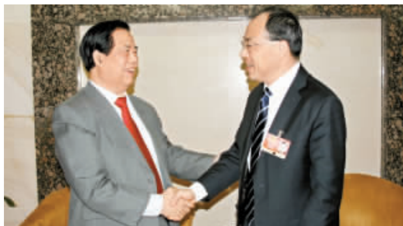
全國人大代表、武漢市長阮成發（右）會見本報總編輯陳錫添一行。

武漢的產業結構中重化工佔很大比重，且以國內市場為主，經過這幾年改造，已經成為新的支柱產業，如鋼鐵、汽車、石油化工、光電子信息，皆有很大市場。阮成發告訴記者，2009 年，武漢還將加快推進總投資